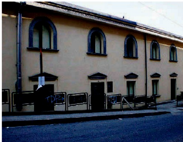
La struttura dell'Umberto I. nel centro storico

Il consigliere Sergio Costanzo invita il sindaco a sollecitare l'Asp perché rispetti la convenzione