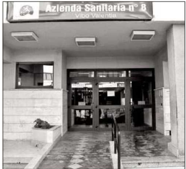
La sede dell'Azienda sanitaria provinciale