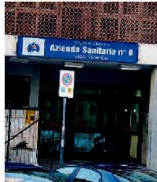
La sede dell'Asp

«Solo gli assistiti che non sono inseriti in tale elenco – aggiungono – ma che ritengono di possedere i requisiti, dovranno recarsi presso gli sportelli dedicati con la copia del documento di identità, il codice fiscale e quant'altro utile al rilascio della tessera sanitaria». Ad avere diritto all'esenzione sono: cittadini di età inferiore a 6 anni e superiore a 65, appartenenti ad un nucleo fa-