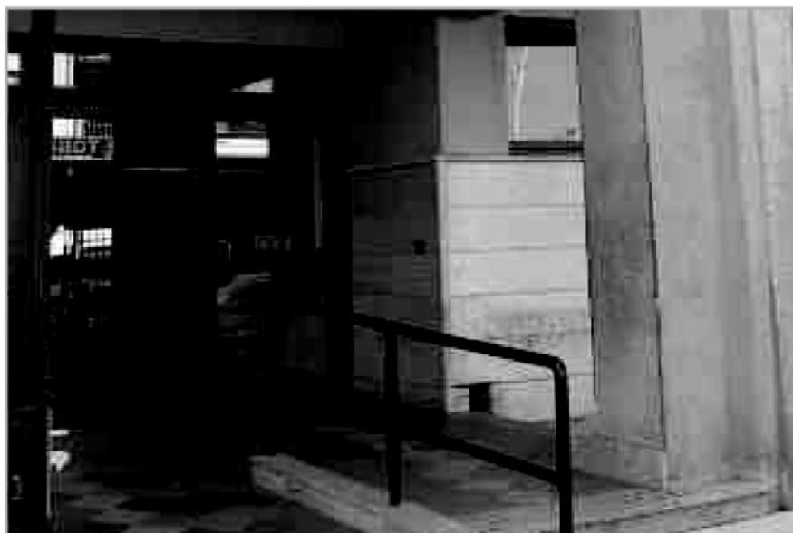
La sede dell'Azienda sanitaria provinciale