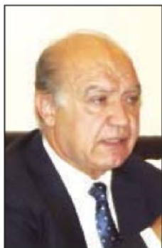
Il dg Nostro

Pezzi indica il reggente anziano ma la Giunta procede