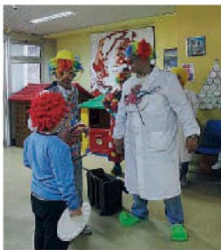
Clown. L'approccio con i bambini ammalati

Per informazioni dettagliate si può visitare il sito www.volontarilametini.org e la pagina di "Facebook" "VoLa Volontari Lametini". Il corso inizierà lunedì prossimo alle 17, nel reparto medicina dell'ospedale cittadino. ◀ (m.s.)