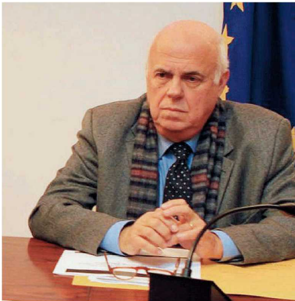
Il commissario. Il gen. Luciano Pezzi guida la struttura che vigila sul piano di rientro dal disavanzo