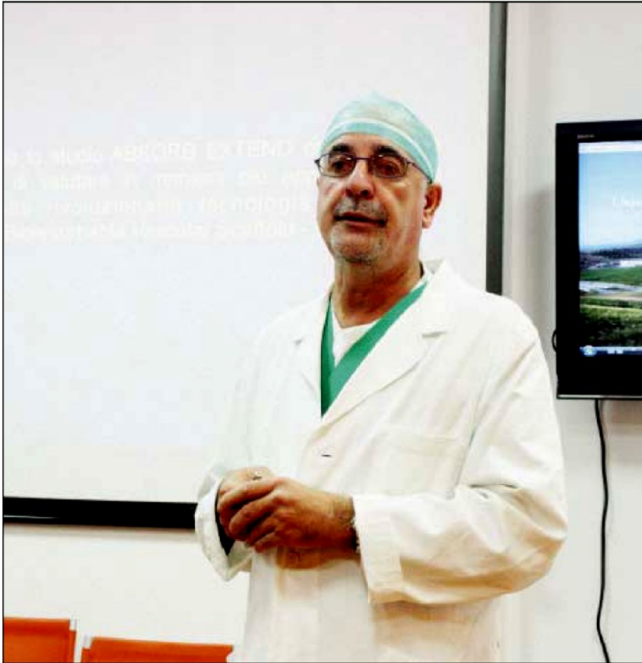
Il professore Ciro Indolfi

Come prevenire le malattie cardiovascolari secondo l'esperto della materia