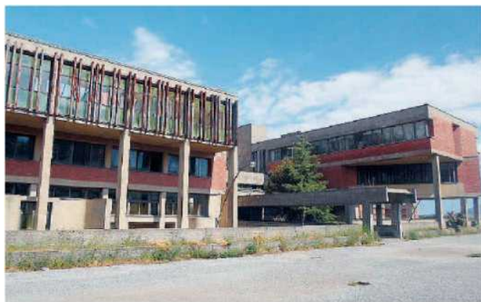
La struttura di Girifalco. Il plesso che non ha mai svolto la funzione assegnatagli