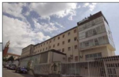
Madonna della Catena: 4,9 milioni

Ospitata in una struttura religiosa, la clinica ha 44 posti letto di riabilitazione intensiva, + 18 posti letto di riabilitazione ad alta intensità +6 di riabilitazione in Day Hospital