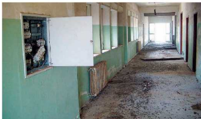
Lo scempio di Rosarno. L'interno del nosocomio sorto nella Piana di Gioia Tauro