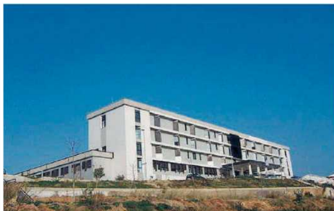
La "cattedrale" del Tirreno. L'ospedale di Scalea è stato vandalizzato