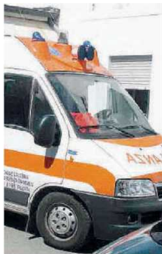
Soccorsi. Vano ogni tentativo

Nel frattempo la Procura di Viboa ha aperto un fascicolo per indagare sulla vicenda e il sostituto procuratore Vittorio Gallucci potrebbe disporre il sequestro della salma e l'esame autoptico. ◀