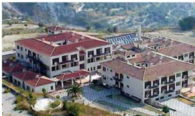
Il "castello di sabbia" dello Ionio. Il nosocomio di Gerace mai aperto