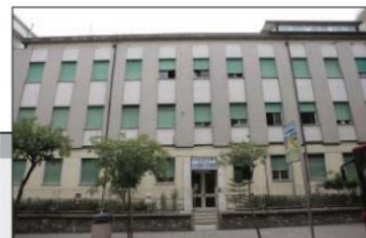
Sacro Cuore: 5.3 milioni di euro

STRUTTURA situata all'ingresso della città, ha 30 posti letto Chirurgia Generale, 3 di chirurgia ambulatoriale, e 26 riabilitazione intensiva e 4 posti letto in day hospital.