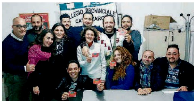
Gli eletti. I nuovi vertici del collegio della Federazione infermieri

Un migliaio i votanti, incremento accolto con grande soddisfazione