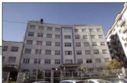
Madonnina: 4,7 milioni

Ospitata in una struttura religiosa, la clinica ha 44 posti letto di riabilitazione intensiva, + 18 posti letto di riabilitazione ad alta intensità +6 di riabilitazione in Day Hospital