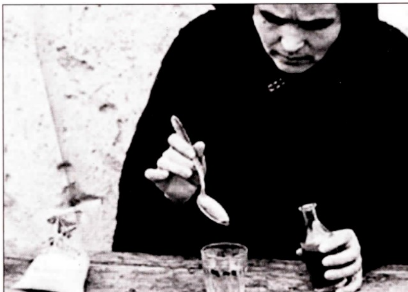
Una donna custode degli antichi riti spesso usati in alternativa alla medicina tradizionale

Certe consuetudini che sopravvivono all'incedere del tempo e della scienza