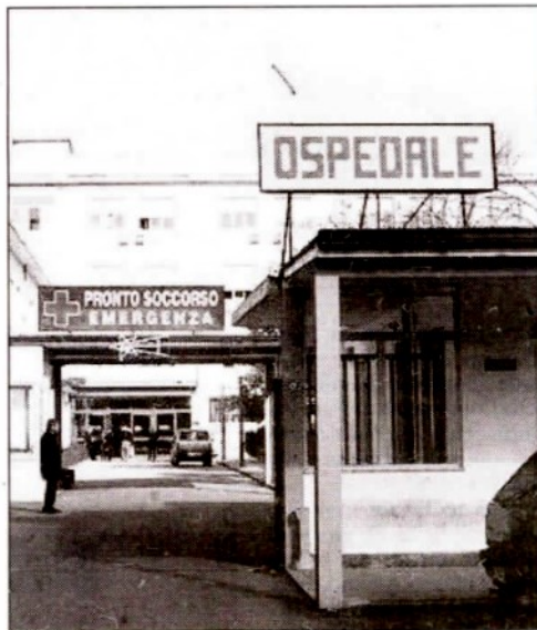
L'ospedale di Vibo Valentia intitolato al grande medico campano

Un autentico luminare testimone di miracolose guarigioni