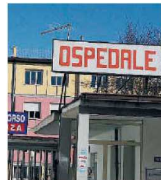
Ospedale Le sale operatorie dovrebbero funzionare meglio

Sono rientrati anche tre dei cinque anestesisti che si trovavano da circa una settimana in malattia. Questo rientro farà girare meglio le sale operatorie che hanno sempre, grazie al sacrificio di tanti operatori sanitari, funzionato per le emergenze che in questo periodo sono veramente tante?». ◀