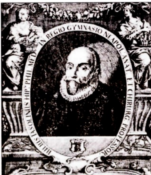
Giulio Jazzolino in una stampa del 1600

Guarì da un glaucoma all'occhio grazie a una reliquia di fra' Andrea d'Avellino