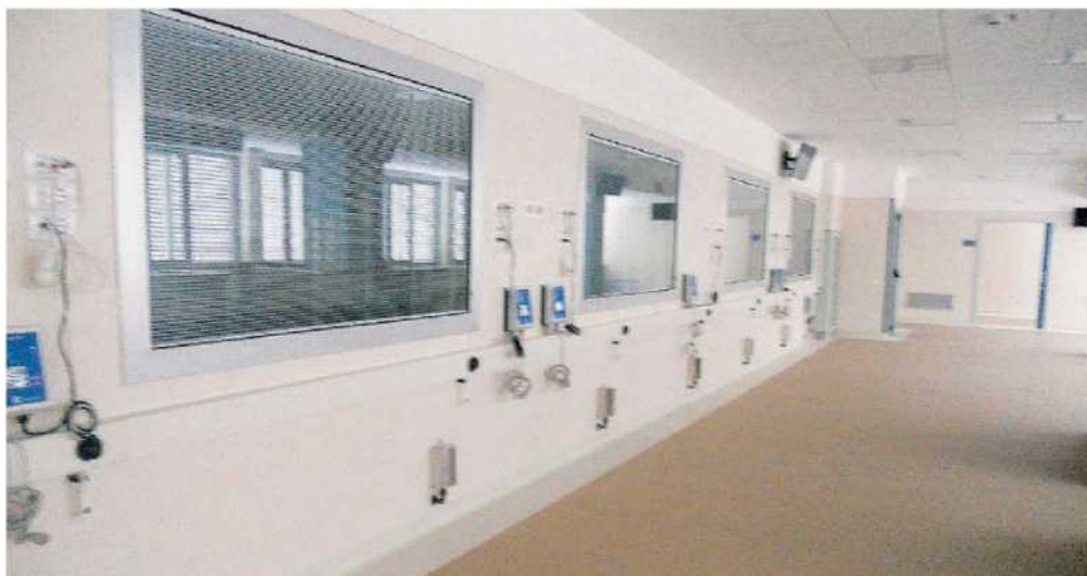
Quando l'attivazione? La sala dialisi appena inaugurata ma ancora priva dei macchinari

● Pareri contrastanti sui tempi di apertura del nuovo reparto, mentre si moltiplicano nei corridoi del primo piano le voci secondo cui ci sarebbe da aspettare almeno altri tre mesi prima di poter effettivamente far entrare i pazienti. Un problema che riguarda il serbatoio di espansione della rete idrica dei nuovi locali sarebbe il motivo che ritarda l'apertura del reparto, ma ovviamente nulla di ufficiale.