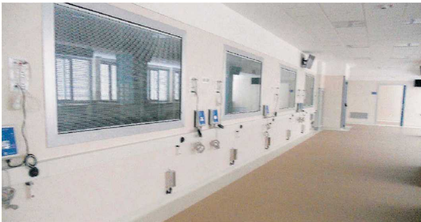
Quando l'attivazione? La sala dialisi appena inaugurata ma ancora priva dei macchinari