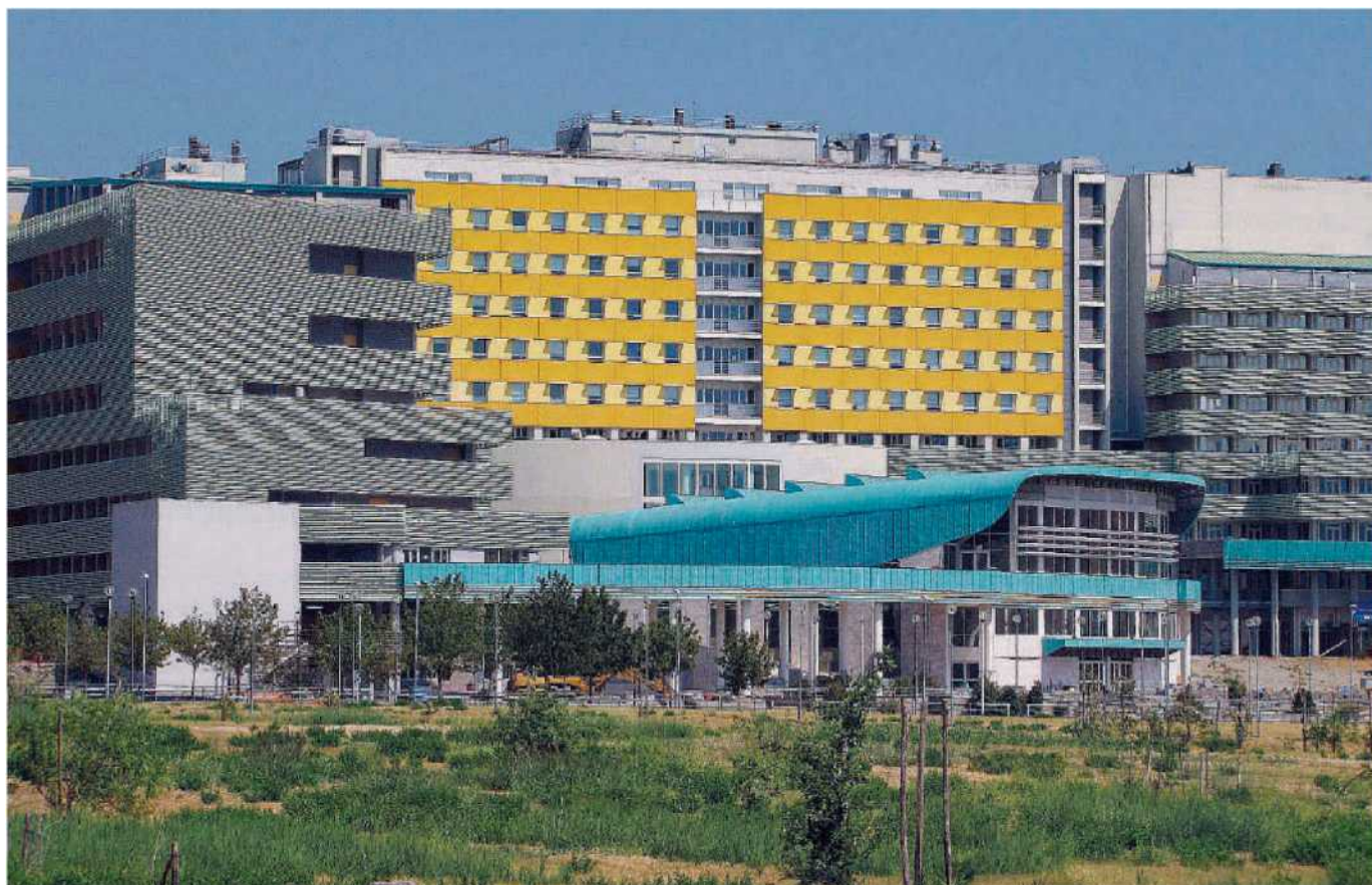
La sede della Campanella al campus universitario. Finora c'è stata una commissione anche logistica tra l'Università e l'ente oncologico

Innumerevoli le manifestazioni dei dipendenti della struttura assistenziale