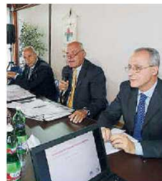
Il punto sulla sanità. L'incontro promosso da Cittadinanzattiva