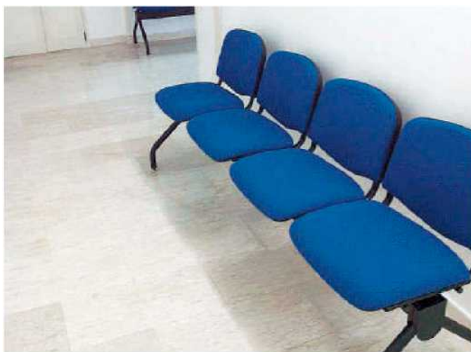
Le nuove poltroncine. Al laboratorio di analisi del nosocomio di Soverato

Sono queste le risposte concrete, che ci si aspetta dagli Enti, quando la stampa mette in risalto alcune deficienze, e non certo risposte scritte, che sono peggiori degli stessi problemi evidenziati. La "vicenda poltroncine", era stata sollevata da