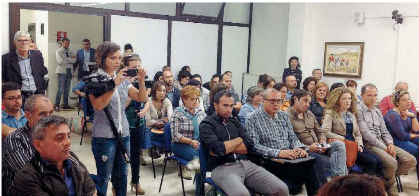
La svolta. Lavoratori ex art. 7 riuniti in Prefettura dove è stato loro comunicato il risultato conseguito con l'assunzione a tempo determinato

● Lo scorso 31 maggio (alla scadenza del contratto) il "benservito" della Provincia ai 76 lavoratori per anni equilibrati sul filo teso, ma ormai logoro, sulla profonda foiba del precariato.