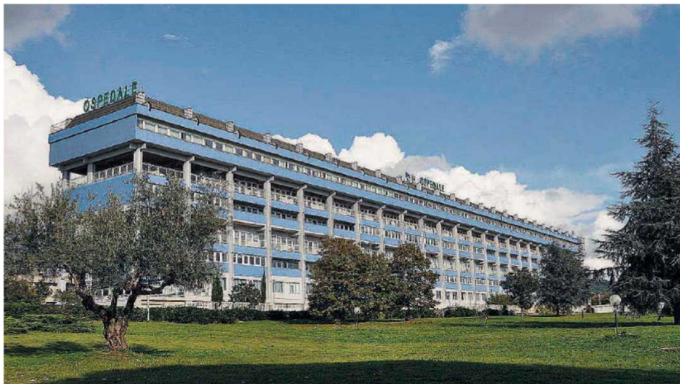
L'ospedale "Giovanni Paolo II". Ancora polemiche sulla reggenza dell'Azienda sanitaria