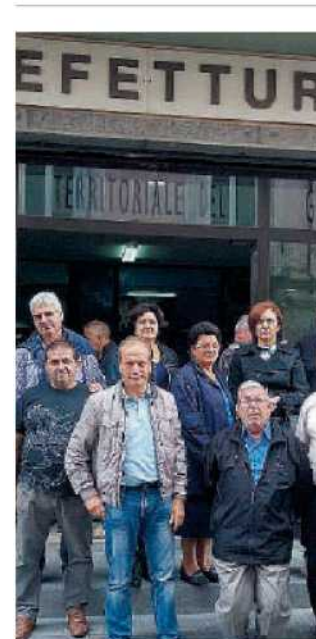
La protesta. Alcuni dei 43 dipendenti della Marenostro

Ma la sede legale dell'azienda dovrebbe essere trasferita a Torino