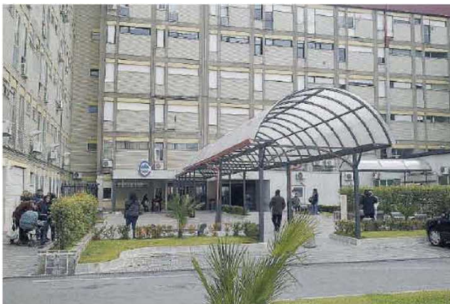
Tragica notizia. L'ingresso dell'ospedale Pugliese a Catanzaro dove la donna ha partorito la bimba morta

del regolamento di polizia mortuaria (Dpr 285/90) che prevede, nei casi in cui non si possa stabilire la causa della morte, di effettuare un accertamento volto a chiarire l'accaduto. La denuncia dei coniugi è stata presentata nelle scorse ore; da qui l'urgenza da parte delle forze dell'ordine di sequestrare subito la documentazione sanitaria della donna che si trovava nel nosocomio di Catanzaro e, di conseguenza, il blocco del riscontro diagnostico già previsto per questa mattina. Il fascicolo su quanto accaduto nelle scorse ore all'ospedale "Pugliese" finirà questa mattina sul tavolo del sostituto procuratore della Repubblica di turno che dovrà poi affidare l'incarico per effettuare l'autopsia a un medico legale. Al momento, ovviamente, nessun sanitario è stato iscritto nel registro degli indagati. Intanto, in attesa di conoscere come si siano svolti i fatti, una famiglia che era in attesa per un lieto evento ora è nel dolore per una morte al momento inspiegabile. ◀