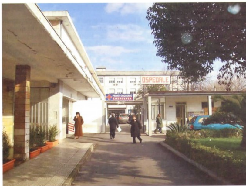
L'ospedale "Jazzolino" di Vibo Valentia. A pagina 16, il nuovo ingresso del pronto soccorso del nosocomio

A Vibo le "grandi manovre" degli ultimi mesi hanno tentato di smorzare il sovraccarico di lavoro gestito a fatica dai pochi medici e infermieri. Alcuni cambiamenti - altri si faranno nelle prossime settimane - hanno dato un aspetto nuovo a quella che, spesso, rappresenta l'anticamera di un ricovero piuttosto che un biglietto di libera uscita che rimanda a casa il paziente rinfancato. Lo "spartiacque", tra i casi più gravi (i codici rossi e gialli) e quelli meno gravi (i verdi e i bianchi), è uno sportello dove si decide chi può passare al di là della porta grigia e chi, giocoforza, deve rimanere al di qua assieme ai parenti. Ancora per poco perché, con gli altri cambiamenti che verranno introdotti a breve, i congiunti