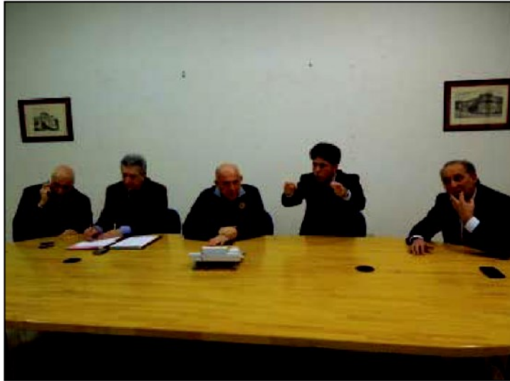
L'incontro in Prefettura