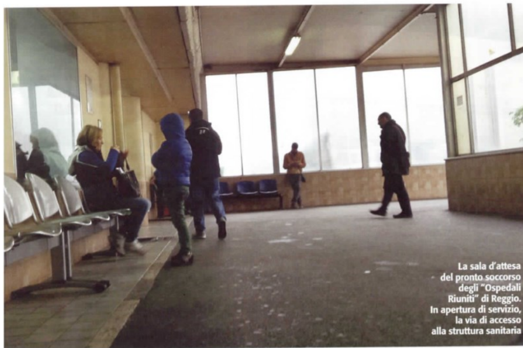
La sala d'attesa del pronto soccorso degli "Ospedali Riuniti" di Reggio. In apertura di servizio, la via di accesso alla struttura sanitaria

lare i sintomi di un'emergenza pur bruciare i tempi di attesa. «Il medico mi ha detto che devo fare una Tac al torace, ma in ospedale mi hanno detto che il primo posto libero è fra tre mesi allora ho seguito il consiglio di mio cugino che è riuscito a farsi fare in giornata una endoscopia – dice un cinquantenne – e ho studiato i sintomi della tubercolosi. Voglio vedere se così ci si riesce. Non ho i soldi per andare da un privato». E non è l'unico. Ai medici basta poco per distinguere le emergenze vere da quelle che tali non sono, ma affrontare quotidianamente la variegata umanità che ogni giorno chiede cura rimane un compito impari. Anche perché non c'è solo l'utenza della provincia a intasare il pronto soc-