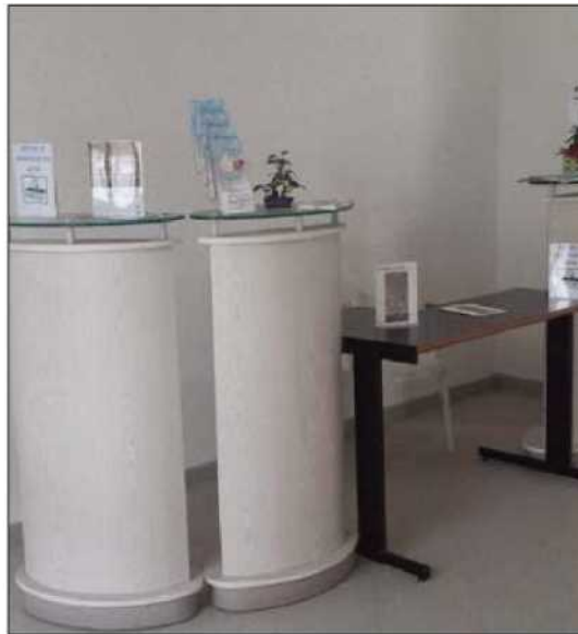
La reception nella sede della fondazione