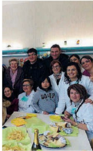
Un sorriso. Un gruppo di partecipanti

Invito, ovviamente, raccolto con piacere. Il piacere di dare sollievo a bambini che, meno fortunati, lottano ogni giorno contro la malattia, trovando sostegno anche in un semplice pensiero e in un sorriso. ◀