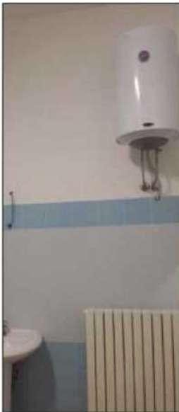
I sanitari della sede