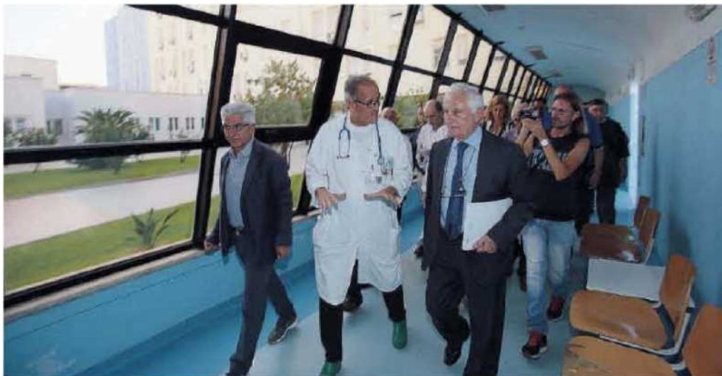
Continua il tour. Il commissario Scura (qui fotografato a Crotone) nonostante l'impegno sulla negoziazione del budget anche ieri ha ispezionato alcune strutture ospedaliere

recato con il commissario Asp Filippelli per visitare l'ospedale e rendersi conto di persona delle necessità della popolazione locale. «Per restare alla vita delle aziende - commenta - la negoziazione del budget significa anche molte altre cose che attengono allo stretto campo lavorativo e manageriale. Migliora il senso di appartenenza: dai commissari straordinari in giù tutti sanno che è cambiato qualcosa rispetto a prima; forse torna l'orgoglio di poter dire "io lavoro all'Annunziata o al Pugliese-Ciacchio o al Bianchi o al Mater Domini o, in generale, nella sanità pubblica". Forse.. perché questo è solo il primo passo, ma proprio perché è il primo ci si aspetta che ce ne siano altri non troppo in là nel tempo. Forse ci si rende conto che la sanità calabrese ha intrapreso la strada della normalità, ancora lunga e tortuosa, ma almeno adesso nota». ◀