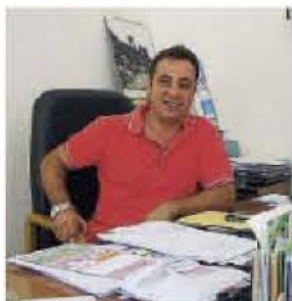
Politiche sociali. Il sindaco Fernando Sinopoli nel suo ufficio

Con queste premesse, il sindaco, ha anticipato il completamento dei lavori del centro diurno per anziani. Una struttura acquisita al patrimonio dell'ente dalla Regione Calabria. L'edificio dove sono stati spesi 50.000 con contributo regionale e 28.000 con fondi comunali, potrebbe ospitare 6 anziani. 170 metri quadrati in via Moleo che l'amministrazione mette già a disposizione per i servizi sociali e per le attività connesse agli anziani.