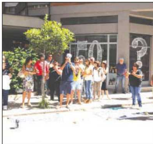
La protesta della Fondazione Campanella e a destra Palazzo Alemanni, sede della giunta regionale dove si è tenuta la riunione dell'esecutivo