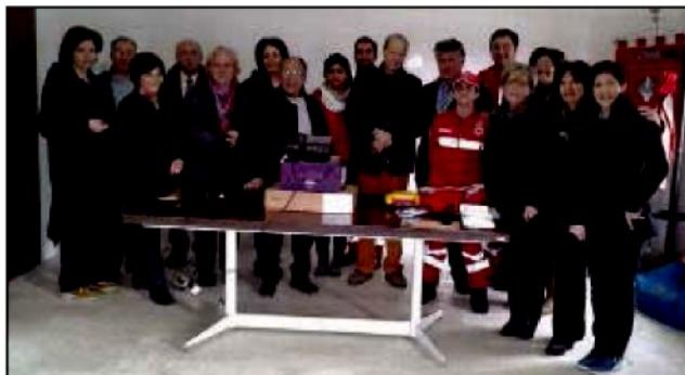
Volontari e soci dell'associazione