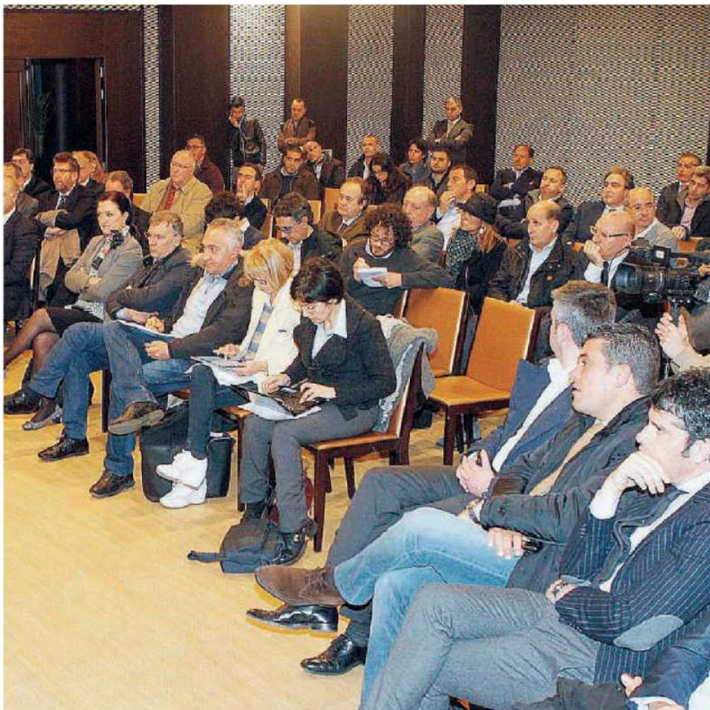
Molti politici tra i giornalisti che hanno seguito la conferenza stampa del governatore Scopelliti