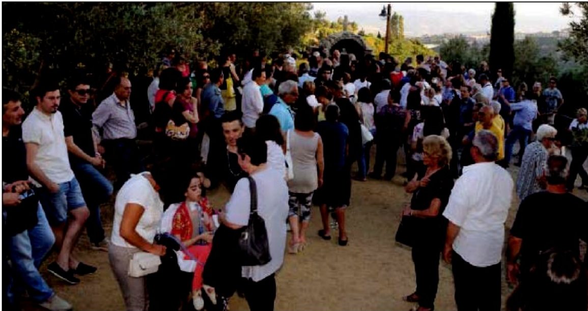
I visitatori che hanno partecipato all'inaugurazione della statuina della Madonna di Medjugorje

BIODIVERSITÀ Cerimonia d'inaugurazione della statua di Maria di Medjugorje