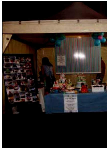
Da sinistra: il dibattito conclusivo della manifestazione e uno degli stand

METTERE insieme la lotta alle dipendenze con le eccellenze del territorio, la prevenzione con tutto ciò che rappresenta il "bello" della Calabria, la Calabria positiva che vuole emergere per lanciare un messaggio di benessere a 360 gradi. Questa la sfida di "Food&Wine Passion", la manifestazione promossa da Ara Associazione contro le dipendenze a favore della prevenzione e dal Comune di Pianopoli, che per tre giorni ha acceso i riflettori sul comune dell'hinterland lametino, diventato vetrina di arte, artigianato, enogastronomia, di quella bellezza "made in Calabria" che chiede di essere raccontata e valorizzata.