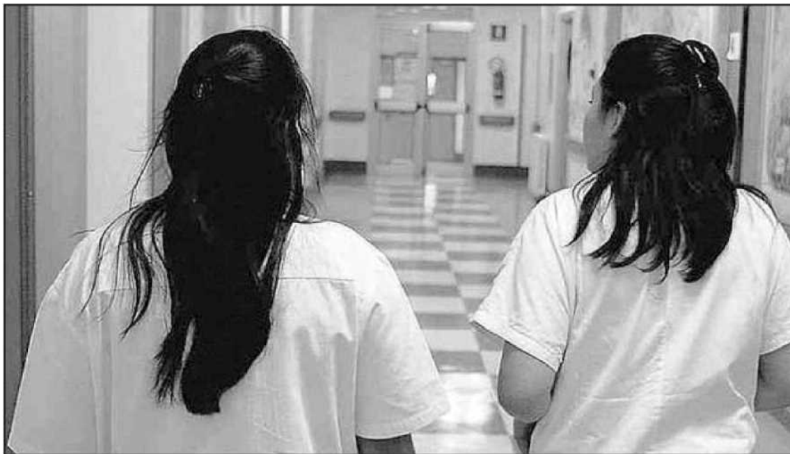
Quaranta giovani infermieri crotonesi indignati