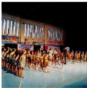
Il saggio. New Gymnasium