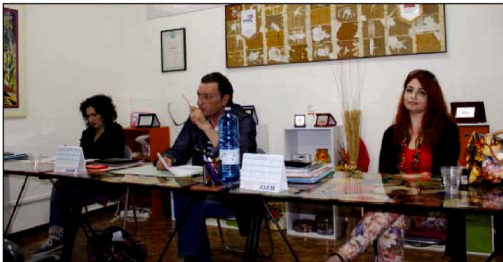
Il presidente del comitato civico "Sopravvivenza" durante uno dei tanti incontri con i cittadini