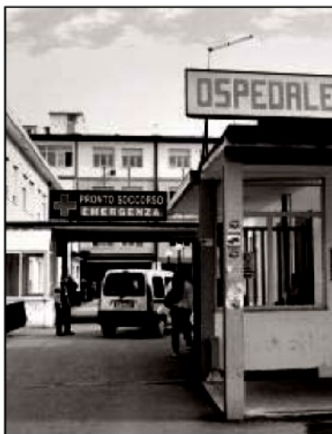
L'ospedale di Vibo Valentia

I coniugi Raco-La Gamba attendono gli esiti dell'autopsia sul piccolo