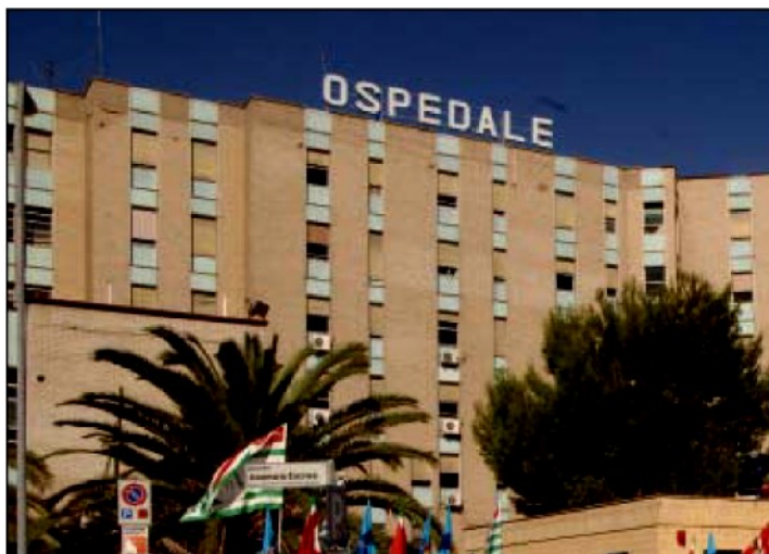
L'ospedale San Giovanni di Dio

I candidati erano 1500. Protestano gli infermieri esclusi