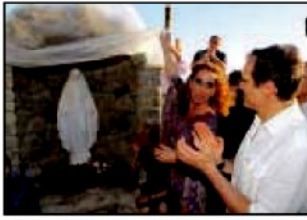
La Madonnina con Ferro e Raiola