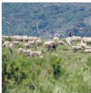
Gregge al pascolo. Accertato un caso di "blue tongue" in un'azienda agricola

Si tratta di un effetto a "cascata" che deriva dall'intervento dell'Asp Dipartimento di prevenzione - Uod Servizio veterinario area A Catanzaro- distretto di Soverato. La profilassi scatta automaticamente in un'area ben circoscritta su impulso delle autorità sanita-