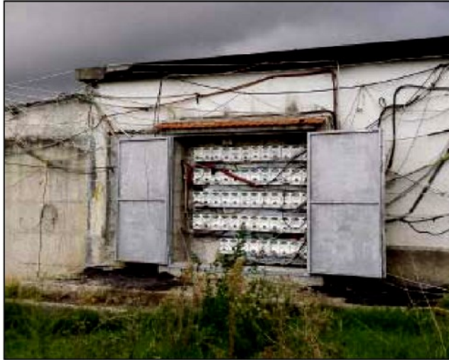
I contatori Enel allacciati abusivamente alla cabina dell'ospedale

BLITZ all'alba dei carabinieri all'interno del campo rom di Scordovillo scattato anche per i continui incendi che causano fumi nocivi oltre che per i continui interventi di bonifica per i rifiuti abbandonati anche all'ingresso del campo rom e spesso incendiati. Un vero e proprio "giro di vite" durante il quale sono state effettuate circa 40 perquisizioni domiciliari, con difficoltà legate allo stato di degrado che caratterizza lo stato dei luoghi della "bidonville" di Scordovillo e che hanno permesso di rinvenire circa tre quintali sparsi di cavi in rame, verosimilmente oggetto degli incendi che caratterizzano i cieli di Lamezia e in particolare l'area che circonda il campo rom di Scordovillo in cui insistono numerose abitazioni, l'ospedale e il Comune di Lamezia Terme, scuole e il commissariato della Polizia.