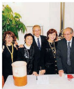
Il direttivo dell'Arn. Il sodalizio opera da oltre venti anni