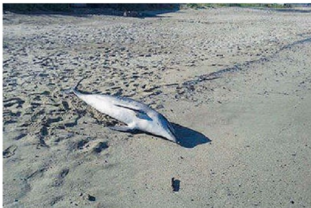
Il delfino rinvenuto sulla sabbia. Recuperato dal Locamare