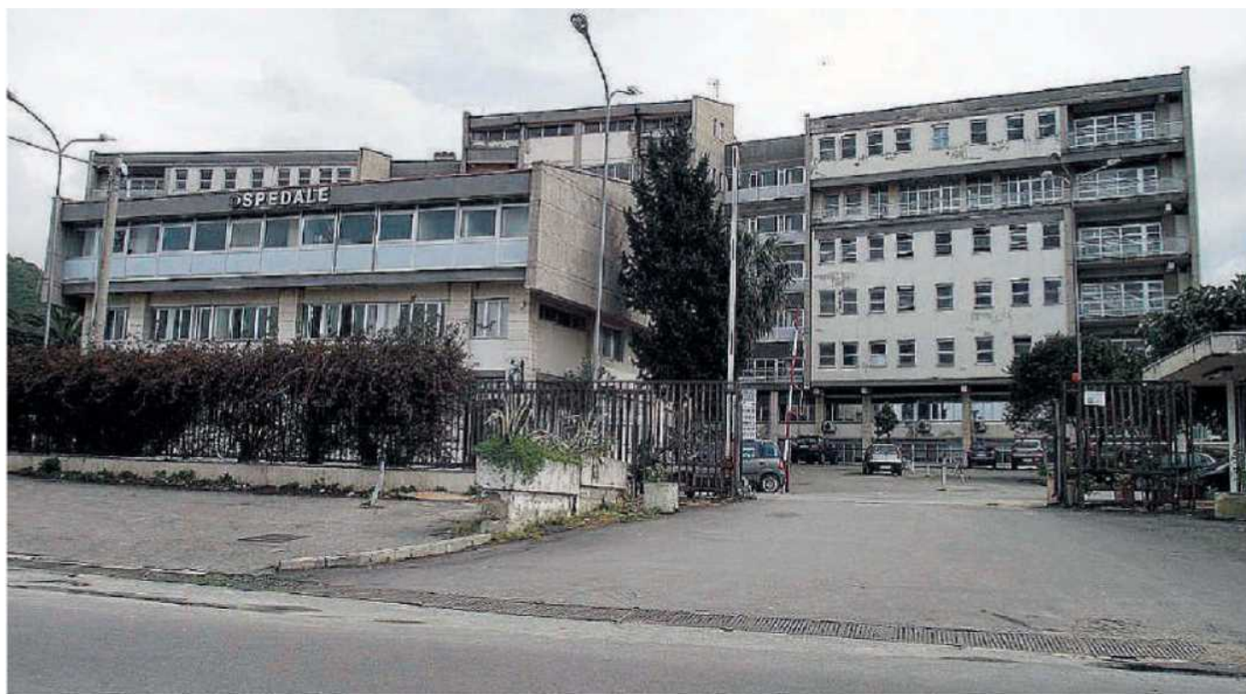
Nosocomio di Tropea La struttura risente la carenza di personale