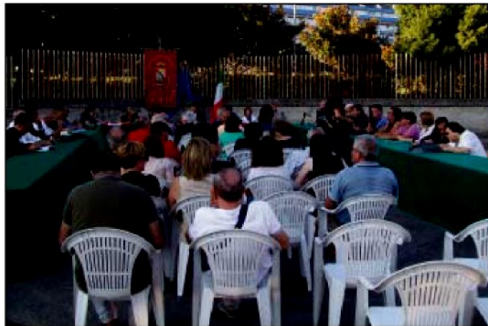
Il consiglio comunale sulla sanità lametina che si è riunito davanti uno dei cancelli dell'ospedale di Lamezia