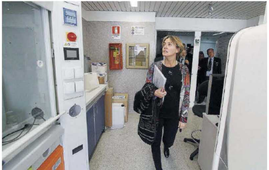
Beatrice Lorenzin. La ministra in occasione della visita al policlinico del campus universitario di Catanzaro

• «Ho la sensazione che diversi settori politici calabresi stanno dando vita ad una sorta di "danza macabra" sul futuro della Regione e su quello del Presidente Oliverio, all'insegna del solito motto che caratterizza certi ambienti: tanto peggio, tanto meglio!», osserva Paolo Naccarato riferendosi alla maggioranza e allo stesso Pd. «Ma c'è davvero - prosegue - qualcuno che in coscienza pensa che sia meglio buttare a mare Oliverio e la sua giunta con tutto ciò che ne conseguirebbe? O che la sottile opera di pervicace indebolimento posta in essere, non abbia come immediata conseguenza pesanti rallentamenti sull'attività di governo? Penso che tutto ciò sia puro masochismo ed autolesionismo sulla pelle dei calabresi. Basta con questi giochetti di vecchia politica. Tutte le energie più responsabili diano una mano e Mario Oliverio si doti al più presto di un "comitato strategico" in grado di orientare l'indirizzo politico e amministrativo».