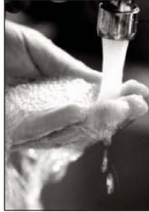
Acqua non potabile in due paesi