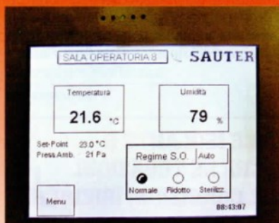
L'indicatore di temperatura all'interno di una sala operatoria. L'umidità è al di sopra della soglia stabilita