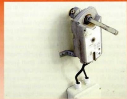
Alcuni strumenti dei reparti sono fuori uso