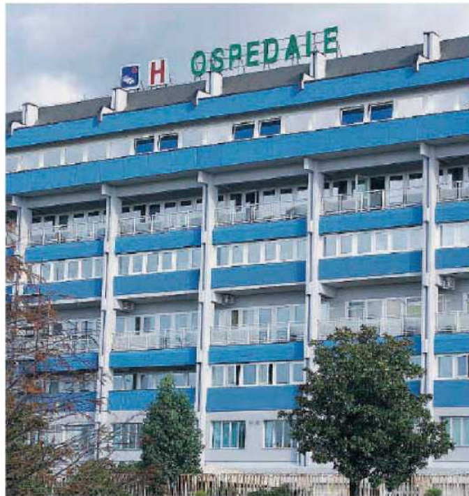
L'ospedale "Giovanni Paolo II"