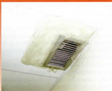
Una riparazione improvvisata ai canali di aerazione

L'ISPEL HA CERTIFICATO UN GUASTO CHE NON GARANTISCE LA STERILITÀ NECESSARIA IN UN OSPEDALE. L'UNICO MODO PER ASSICURARE LA SICUREZZA DEI PAZIENTI