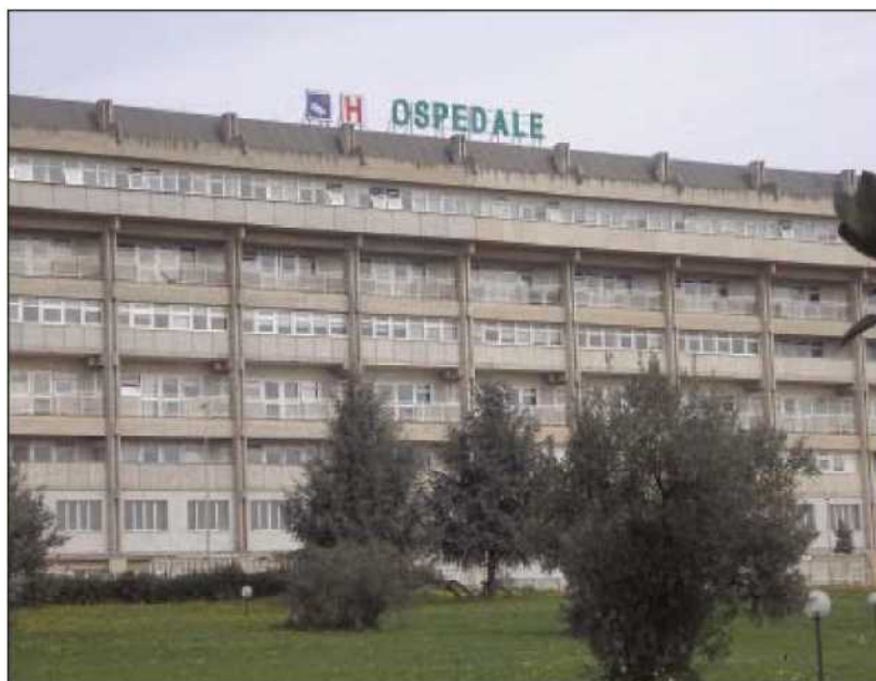
L'ospedale di Lamezia