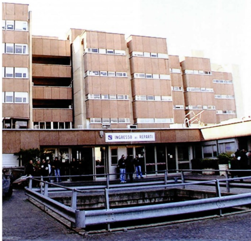
A sinistra, l'ospedale "Riuniti" di Reggio. Secondo la normativa in vigore, l'umidità degli ambienti deve garantire il benessere del personale

condizioni termoigrometriche idonee allo svolgimento delle attività previste, conciliando le esigenze di benessere del personale con quelle primarie dell'utente», ma soprattutto a «contenere la concentrazione del particolato e della carica microbica aeroportata, in modo tale da non recare danno alla salute dei soggetti presenti nell'ambiente della sala operatoria». In pa-