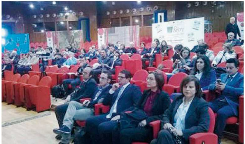
Il pubblico presente alla presentazione del progetto