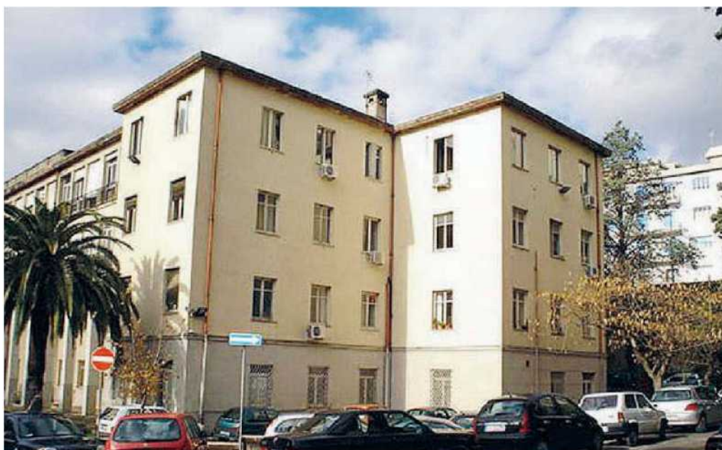
La sede dell'Azienda sanitaria provinciale