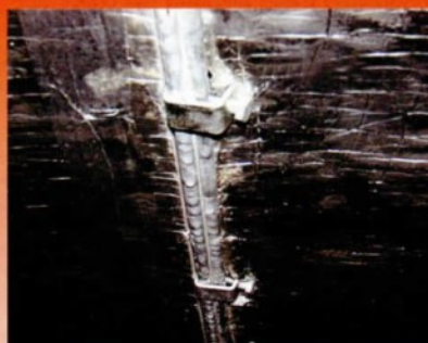
La condensa nei canali di aerazione