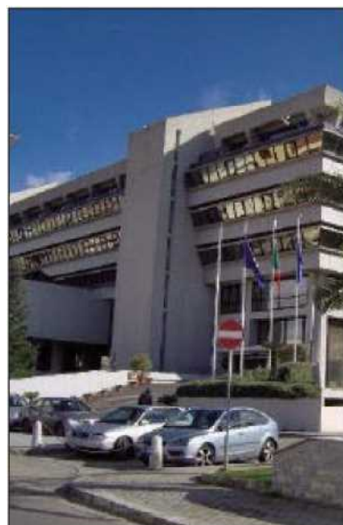
La sede della Regione Calabria