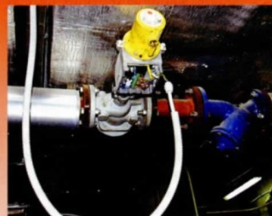
Una delle valvole guaste per la produzione di vapore