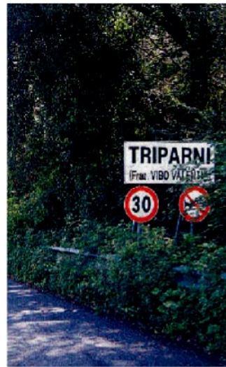
L'ingresso di Triparni

contrarre malattie tumorali. I giovani, dal canto loro, hanno pensato bene di contattare la trasmissione televisiva di Canale 5 "Striscia la notizia" in modo da sollecitare l'attenzione delle istituzioni locali. A loro avviso il fatto che in media all'interno di una medesima famiglia ci siano dall'uno ai due casi di tumore è davvero inquietante. E partendo dal presupposto che molto probabilmente la questione legata all'inquinamento dell'aria dovrebbe essere scongiurata, essendosi riscontrato finora solo un caso di tumore alle vie respiratorie, «bisognerebbe puntare - hanno detto - su un'analisi epidemiologica se-