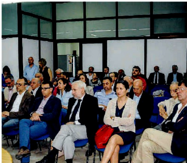
L'auditorio. Numerosi gli amministratori presenti al dibattito