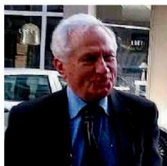
Massimo Scura. Il commissario sta riformando la sanità calabrese

che che si lavora per l'adozione di una tariffa unica condivisa da tutte le strutture socio-sanitarie (rsa e rsd) della regione. Per definirlo è stato dato mandato ad un tavolo paritetico. Intanto si registra la presa di posizione di Fp Cgil, Fp Cisl Calabria e Cgil Calabria sul decreto emanato 62 ieri dal commissario Scura per modificare il regolamento regionale che norma le tariffe per le strutture extraospedaliere sanitarie e sociosanitarie. Il decreto afferma che le tariffe saranno determinate in