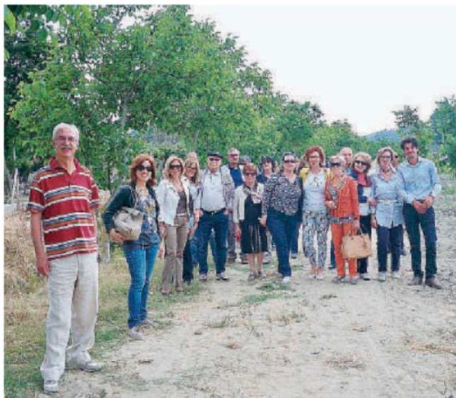
I protagonisti. Un momento della visita nell'orto familiare