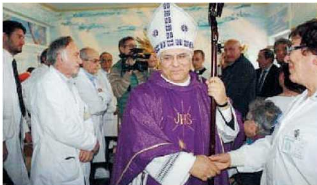
L'arcivescovo arriva nella cappella del presidio Pugliese