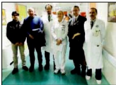
Medici e dirigente

COMBATTERE l'emigrazione sanitaria, sostenere la ricerca, la cura e il radicamento dei centri d'eccellenza sul territorio calabrese.