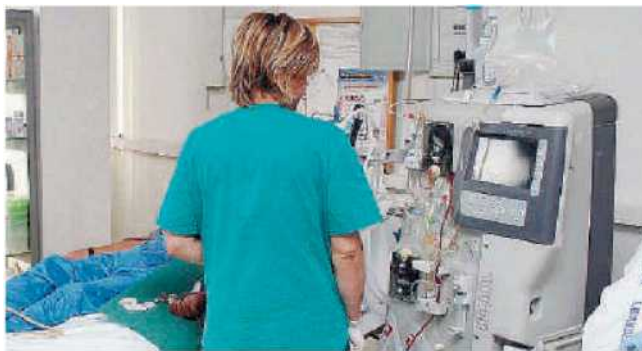
Il centro dialisi nell'ospedale cittadino