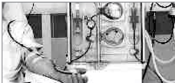
La richiesta dell'Aned avanzata ai vertici dell'Asp

Scarmozzino: equilibrare i posti rene sul territorio