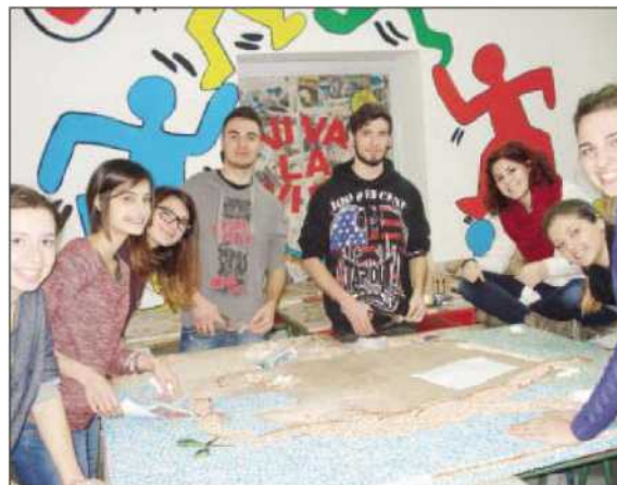
Alcuni dei ragazzi che hanno preso parte all'iniziativa