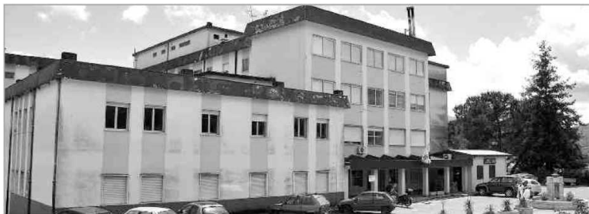
A RISCHIO? La sede dell'ospedale di Soveria Mannelli