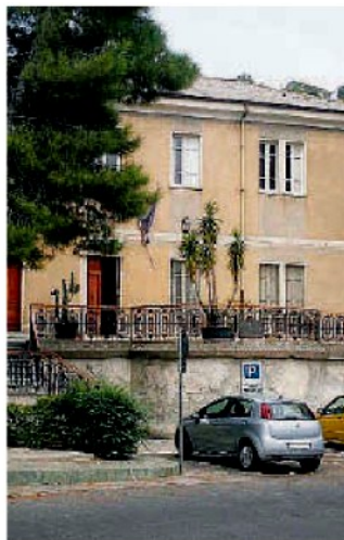
Il municipio di Falerna

In programma la pulizia dei locali, lo sgombero di contenitori di cartone e faldoni, la sistemazione dell'impianto elettrico; la tinteggiatura e il rifacimento dei battenti; la sistemazione dell'archivio; l'eliminazione delle barriere architettoniche, delle fonti di umidità insieme con la realizzazione di nuovi servizi igienici e con la sostituzione degli infissi. Dovrebbero essere gli operai dell'Ente a eseguire i lavori. L'idea del sindaco è di procedere gradualmente alla siste-