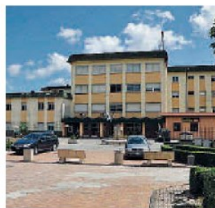
Reventino. L'ospedale di Soveria Mannelli