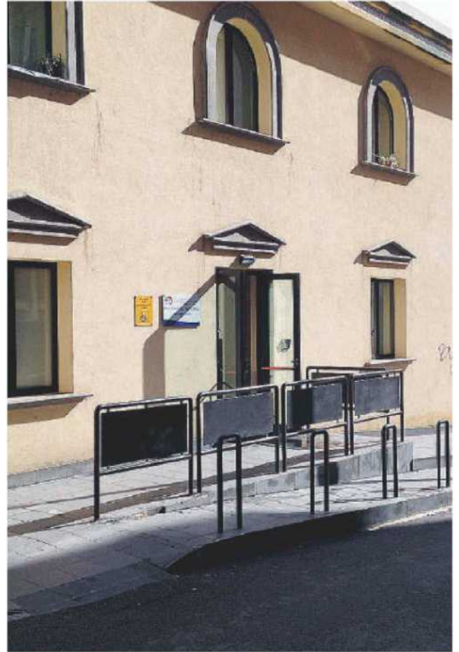
Ambulatori. L'ingresso del Polo sanitario territoriale dell'Asp che si trova sul retro dell'Umberto I

nella prenotazione, secondo la versione della donna, non abbia risposto nessuno. Il padre della signora si è quindi presentato al polo di via Acri per spiegare l'accaduto. Qui avrebbe ricevuto la notizia da parte dell'impiegato addetto al servizio che nei giorni di sabato e domenica l'ufficio preposto a rispondere alle cancellazioni delle prenotazioni è chiuso. L'impiegato avrebbe persino accompagnato il padre della paziente dal responsabile dell'ufficio addebiti che gli avrebbe comunicato di presentare una giustificazione per iscritto e che a breve avrebbe ricevuto risposta. Infatti, il 12 maggio l'Asp ha inviato alla donna una richiesta di pagamento di 15 euro per non essersi presentata a visita medica. Da lì una serie di ping pong tra l'ufficio addebiti e quello legale che hanno costretto infine il padre della donna non solo a pagare i 15 euro ma anche a presentare reclamo al direttore generale chiedendo il rimborso di quanto versato. Documento protocollato il 26 giugno. Sinora nessuna risposta. E tutto perchè sabato e domenica nessun operatore ha risposto alla telefonata di disdetta della figlia. ◀