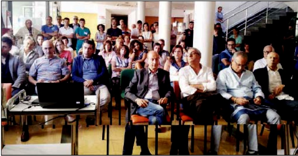
Sindacalisti e personale in trincea per salvare Villa dei gerani dalla paventata chiusura

Callipo: «Il rimedio è uno solo, mandare a casa chi ha affossato la sanità»