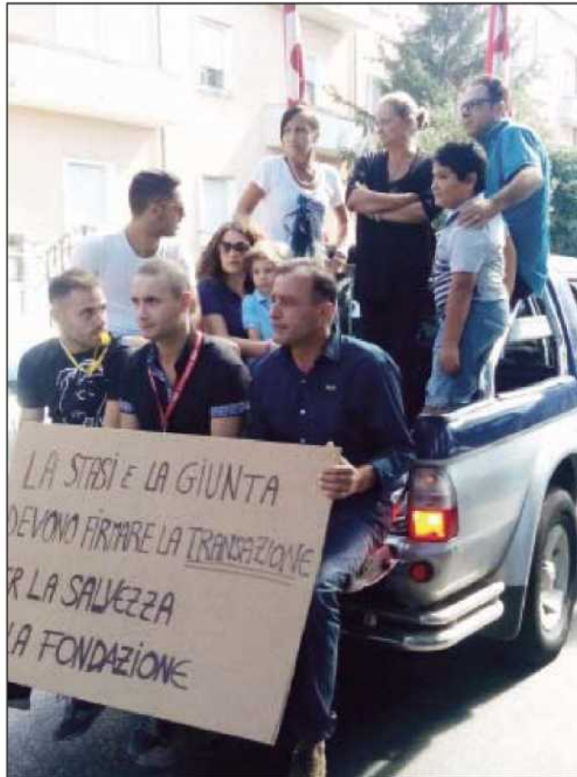
L'ultima protesta dei dipendenti della Campanella