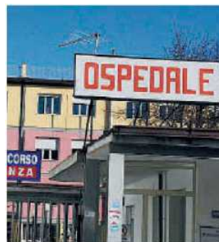
L'ospedale Jazzolino. I reparti rischiano di chiudere

«L'incontro nell'ufficio territoriale di Governo promosso dal Prefetto – osserva Curtosi – pone ulteriormente l'accento sulla sempre più grave situazione esistente nel delicato settore, dove pare diventi sempre più complicato pensare ad un intervento per superare le difficoltà». Nè è servita, secondo il sindacalista, «l'autorevole presenza del sub commissario regionale Luciano Pezzi che ha stretto le spalle scaricando il compito delle scelte al commissario dell'emergenza sanitaria che il governo centrale non si sa perchè tarda a nominare dopo il default dell'ex governatore Giuseppe Scopelliti». E a placare gli animi non è bastata l'avvenuta firma del contratto d'appalto per la realizzazione del nuovo ospedale. Alla luce di queste riflessioni per Curtosi le responsabilità non possono che ricadere sul «fallimento della classe politica vibonese che non è mai riuscita a far capire che la condizione sanitaria del territorio incomincia ad essere allarmante e non soltanto per la sua precarietà strutturale, ma anche per l'assurda condizione del suo organico». Debbono debellare la cultura degli sprechi, ma pure pensare ad un serio e concreto rinnovamento della classe politica, per il sindacalista, resta uno degli obiettivi essenziali. «Chi ha chiesto ed ottenuto il consenso elettorale – conclude Curtosi – deve esporre soprattutto in termini di impegno e trasparenza il proprio operato perchè il cittadino ha diritto di sapere». ◀ (v.s.)