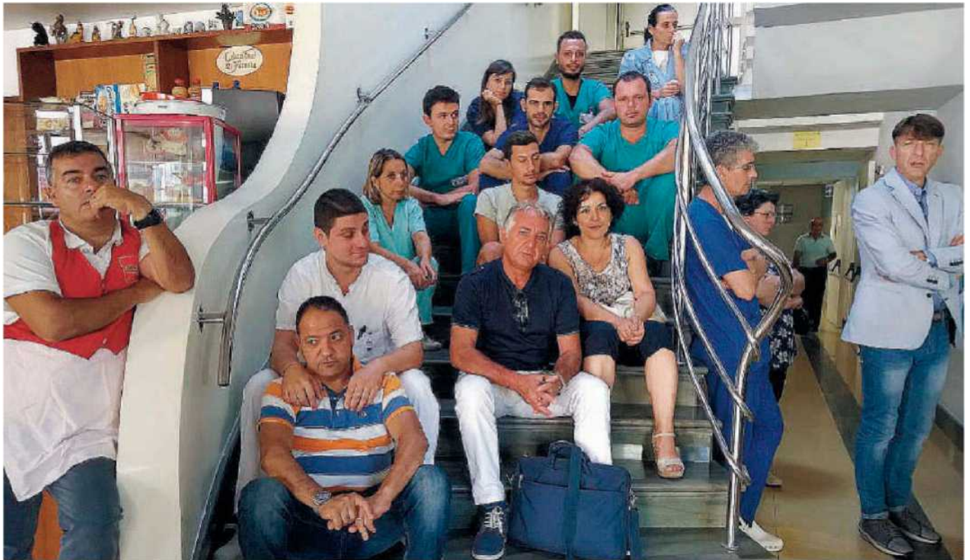
L'attesa dei dipendenti. Sono circa 84 i lavoratori della Casa di cura Villa dei Gerani a rischio a causa della sospensione delle attività