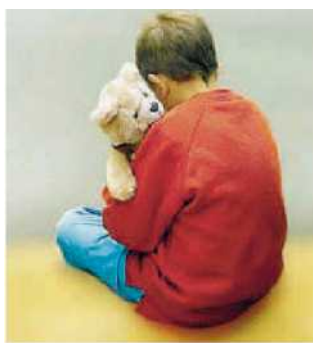
La solitudine. Le difficoltà dei bambini affetti da autismo

Agli operatori che si sono formati sull'argomento e hanno maturato esperienza sul campo sarà rilasciato un certificato che riconoscerà il livello di apprendimento conseguito e consentirà di partecipare ai corsi per livelli di formazione ultraspecialistica. ◀ (Sa.Inc.)