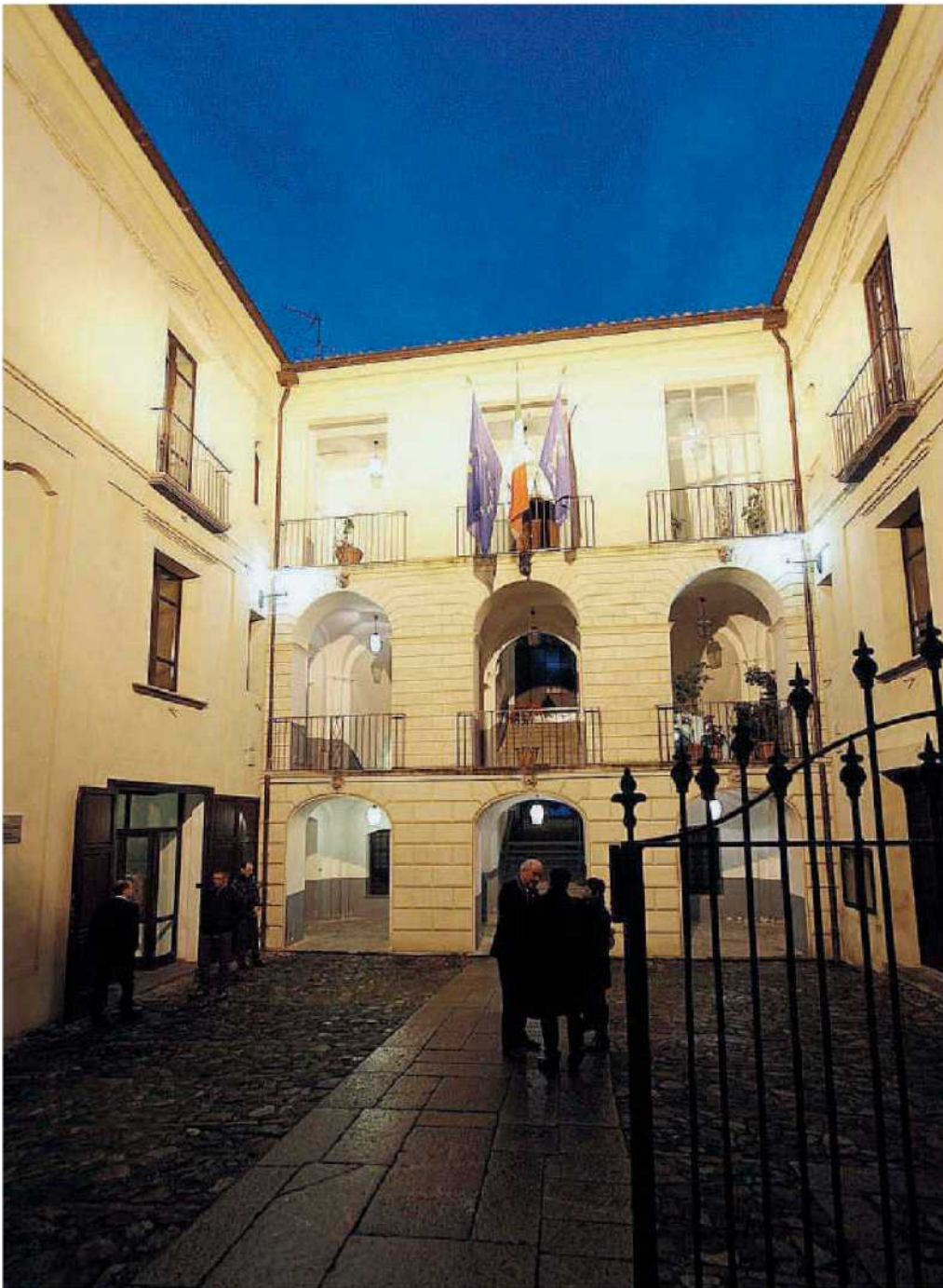
Palazzo Alemanni. Giorni di scelte difficili. E "pericolose"