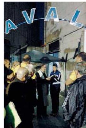
Nuova sede. Un momento dell'inaugurazione

«Ultimamente il sodalizio, per potere facilitare la propria missione a favore dei più deboli, sta usufruendo di un furgoncino messo a disposizione dal Comune. L'impiego del mezzo sta semplificando notevolmente il trasporto dei malati negli ospedali e la loro partecipazione a numerose manifestazioni religiose e non. ◀ (f.o.)