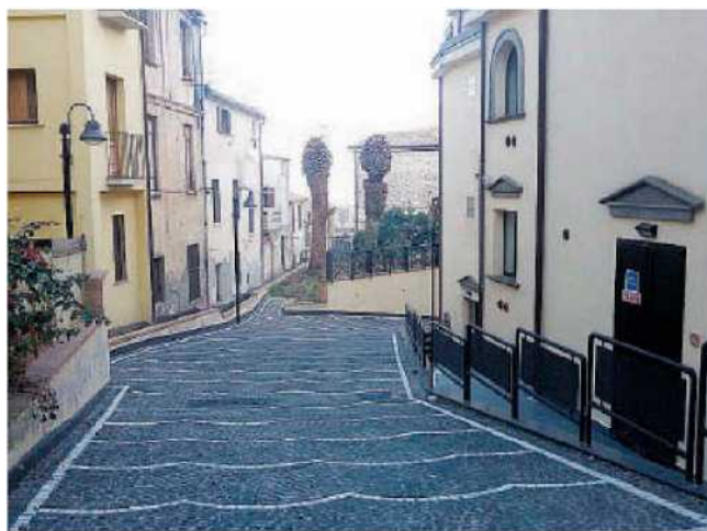
Il cortile. Sullo sfondo le palme ai cui piedi si è sviluppato l'incendio

Sul posto ieri mattina sono intervenuti Carabinieri e Vigili del fuoco