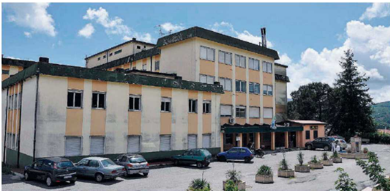
Ospedale di montagna. A Soveria medici e reparti ridotti all'osso. Pazienti in difficoltà