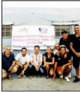
Il gruppo del 118 al kitesurf

L'ASP di Catanzaro ha predisposto, in occasione del campionato mondiale di kitesurf a Gizzeria Lido, una postazione sanitaria del 118 per garantire un immediato intervento in caso di situazioni di urgenza e assistenza per tutto il periodo della manifestazione, dal 9 al 19 luglio 2015. Sia gli atleti che gli spettatori, in caso di necessità, potranno usufruire di un'assistenza immediata e professionale.