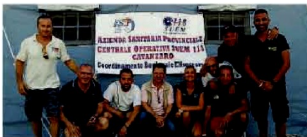
Il personale del 118. In servizio straordinario a "Pesci e Anguille"