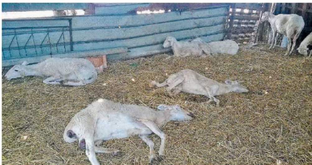
Colpite da "bluetongue". Animali morti nell'ovile di un'azienda zootecnica nella zona interessata dall'epidemia di "lingua blu"

● La Bluetongue è una malattia infettiva, contagiosa, dei ruminanti. È conosciuta anche con il nome di Febbre catarrale dei piccoli ruminanti, e, in Italia, di Lingua blu. Questo nome deriva dalla cianosi della mucosa linguale osservata negli animali colpiti in modo più grave. La pecora è la specie più sensibile all'infezione e presenta sintomi gravi; bovini e caprini vengono infettati ma sono più resistenti.