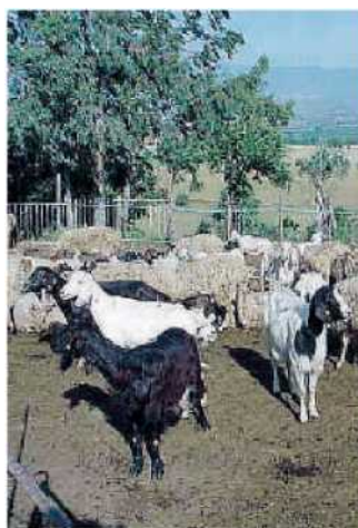
Ovini al pascolo. Allevamenti a rischio per la febbre catarrale