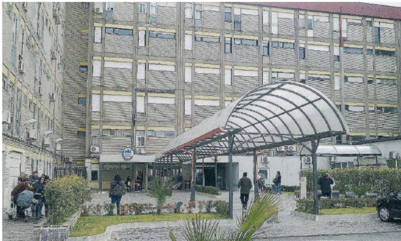
Le proteste non finiscono mai. L'ospedale Pugliese è sempre al centro delle polemiche