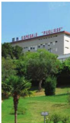
L'ospedale "Pugliese" di Catanzaro. Il sindacato fa riferimento alla chiusura del reparto.