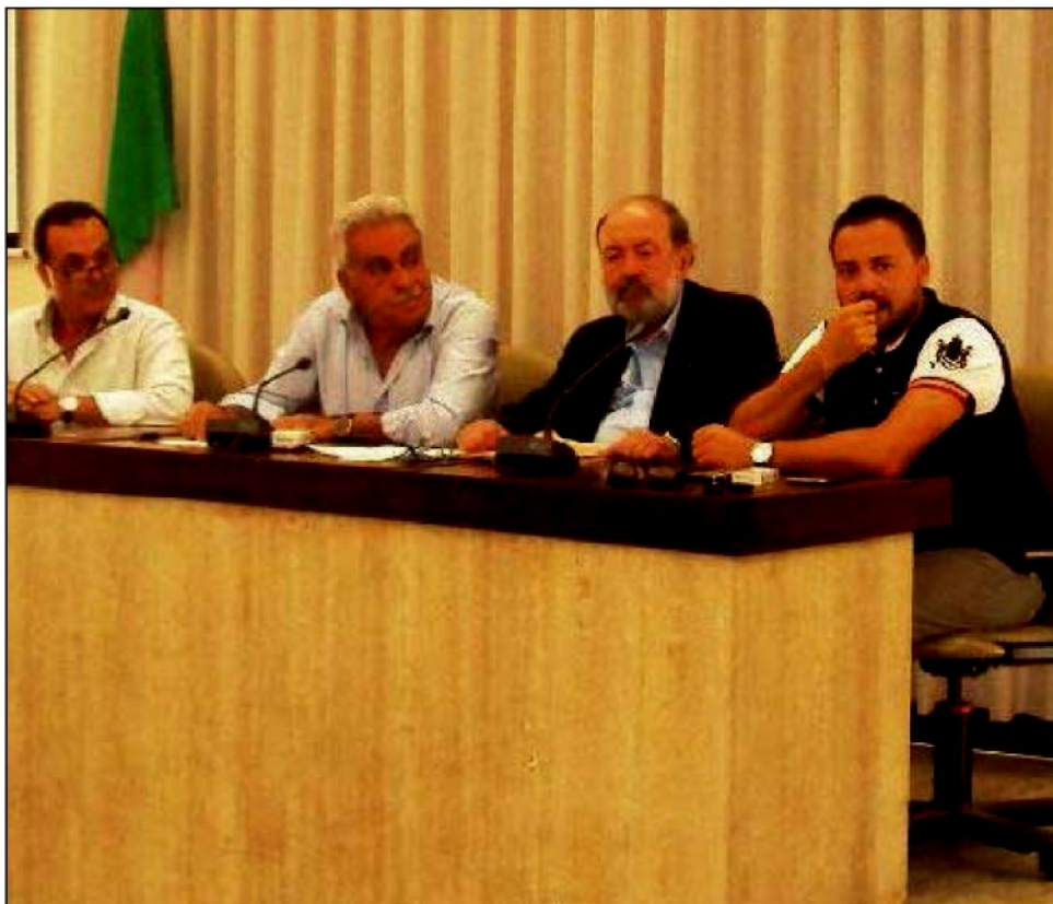
La conferenza dei sindaci

Il sindaco di Cutro propone una richiesta congiunta dei 27 Comuni del Crotonese