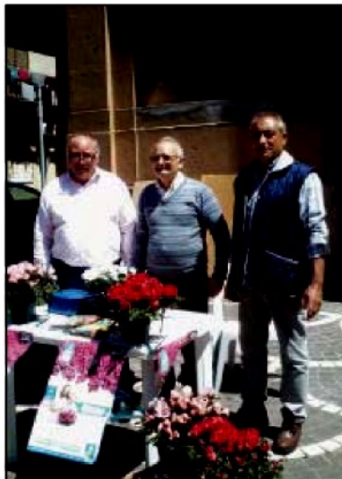
Lo stand della Pro Loco in piazza