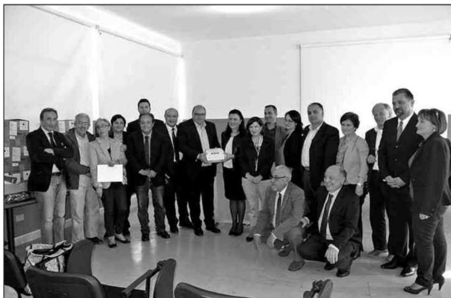
La consegna dei 15 defibrillatori ai rappresentanti dei comuni