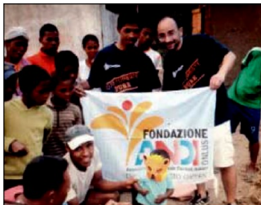
Alcuni volontari dell'associazione dell'Andi

NOBILE e utile iniziativa anche a Catanzaro per la lotta contro il tumore del cavo orale. È l'Oral Cancer Day, l'appuntamento giunto ormai alla ottava edizione, organizzato da Fondazione Andi con lo scopo di sensibilizzare i cittadini sull'importanza di una diagnosi precoce nel combattere questa forma tumorale e sul fondamentale ruolo della prevenzione.