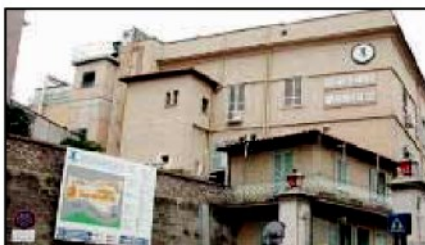
L'ospedale pediatrico Bambin Gesù di Roma