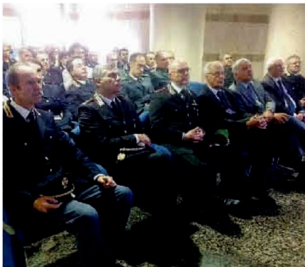
Al Polifunzionale. Illustrato il progetto “Cuore” per rivedere il proprio stile di vita