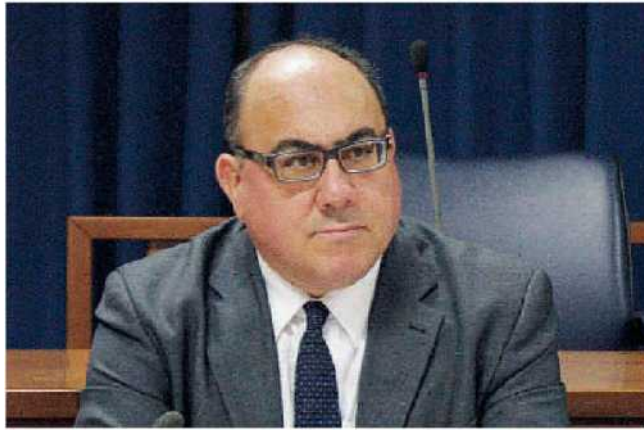
L'assessore regionale. Carlo Guccione il più votato in Calabria