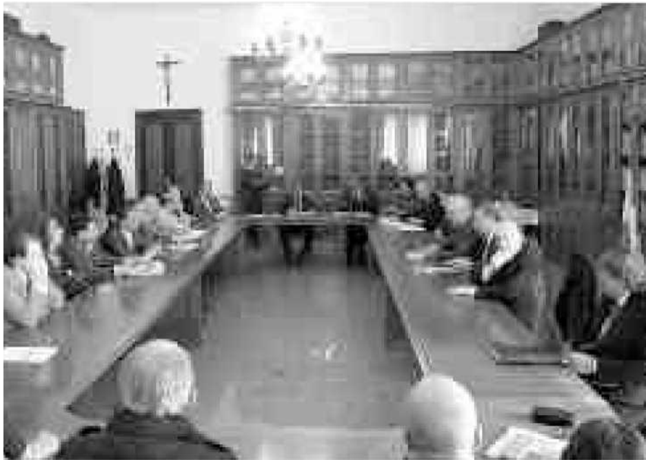
AL TAVOLO La conferenza regionale permanente tenutasi in Prefettura che ha visto la partecipazione di tutte le istituzioni