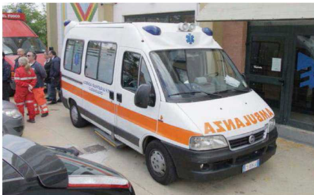
Gli autisti delle ambulanze del 118 chiedono che l'indennità di rischio venga reintegrata nelle loro buste paga

Nel corso della verifica, gli ispettori hanno raccolto le testimonianze degli autisti e anche di alcuni medici, chiedendo anche alcuni documenti che riguardano le rispettive posizioni lavorative, necessari per cercare di capire fino in fondo la situazione. Tra il materiale richiesto, anche il bando di concorso, le buste paga degli autisti-soccorritori, i loro contratti, i vari ordini di servizio, gli attestati relativi alla formazione professionale degli autisti ed eventuali accordi sindacali. Tra l'altro, è molto probabile che nei prossimi giorni gli ispettori del lavoro si metteranno in contatto proprio con i vertici dell'azienda sanitaria, in modo da riuscire ad avere il quadro completo, nel quale, al momento, l'Asp propone e ribadisce le sue ragioni e, di contro, gli autisti-soccorritori accampano le proprie. ◀