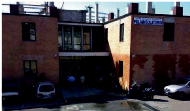
Il poliambulatorio dell'Azienda sanitaria provinciale a Lido