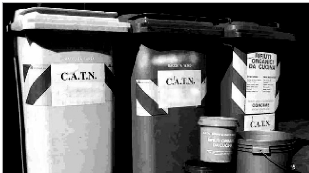
Nella foto alcuni contenitori destinati alla raccolta differenziata dei rifiuti

Il Forum delle associazioni contesta il punto che riguarda la differenziata