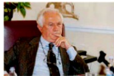
Il commissario Scura nei giorni scorsi ha varato la bozza della rete territoriale delle Asp

Scura: la Regione non deve adeguarsi alla sanità privata ma viceversa