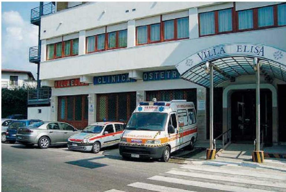
La clinica privata convenzionata. A Villa Elisa è stato praticato il cesareo alla partoriente