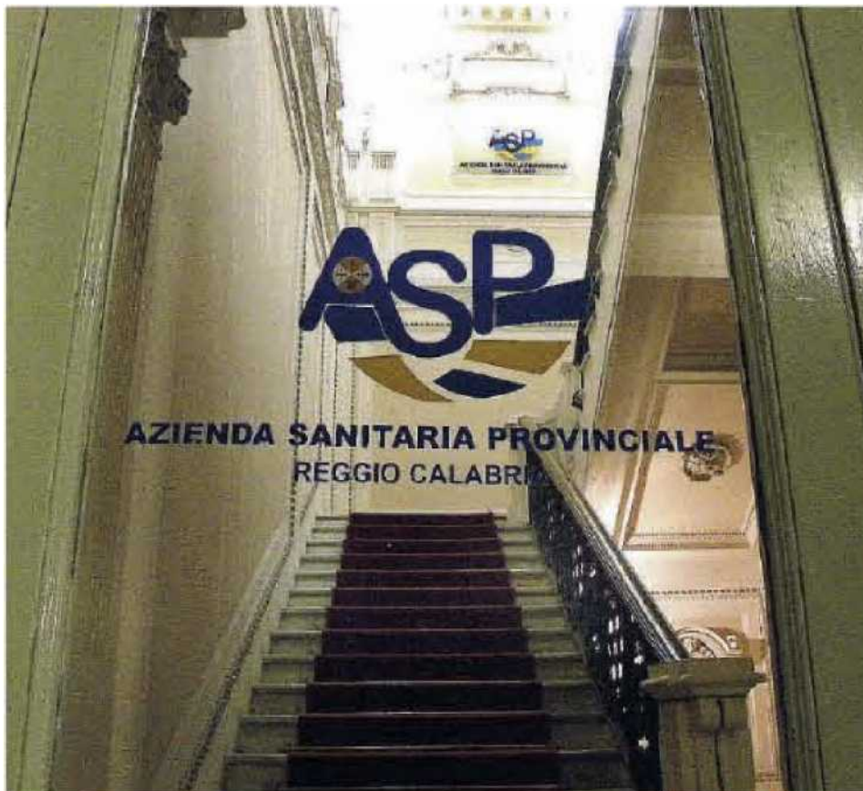
In attesa. La sede dell'Azienda sanitaria provinciale, a Reggio Calabria