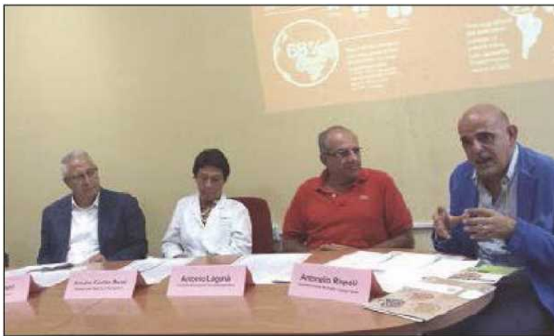
La conferenza stampa per la presentazione dell'evento