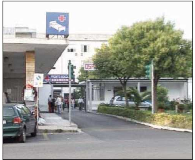
L'ingresso dell'ospedale di Vibo Valentia