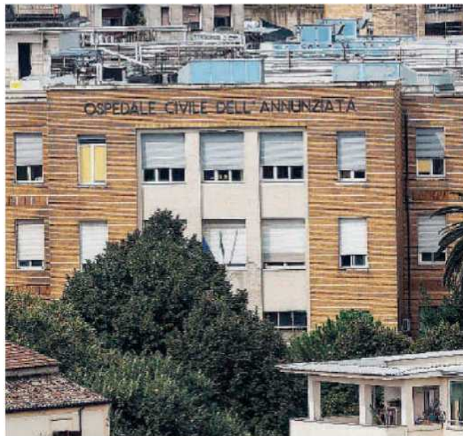
Casi limite. Il campus universitario di Catanzaro, sede della Fondazione Campanella, e l'Annunziata di Cosenza: due volti della difficoltà del comparto sanitario