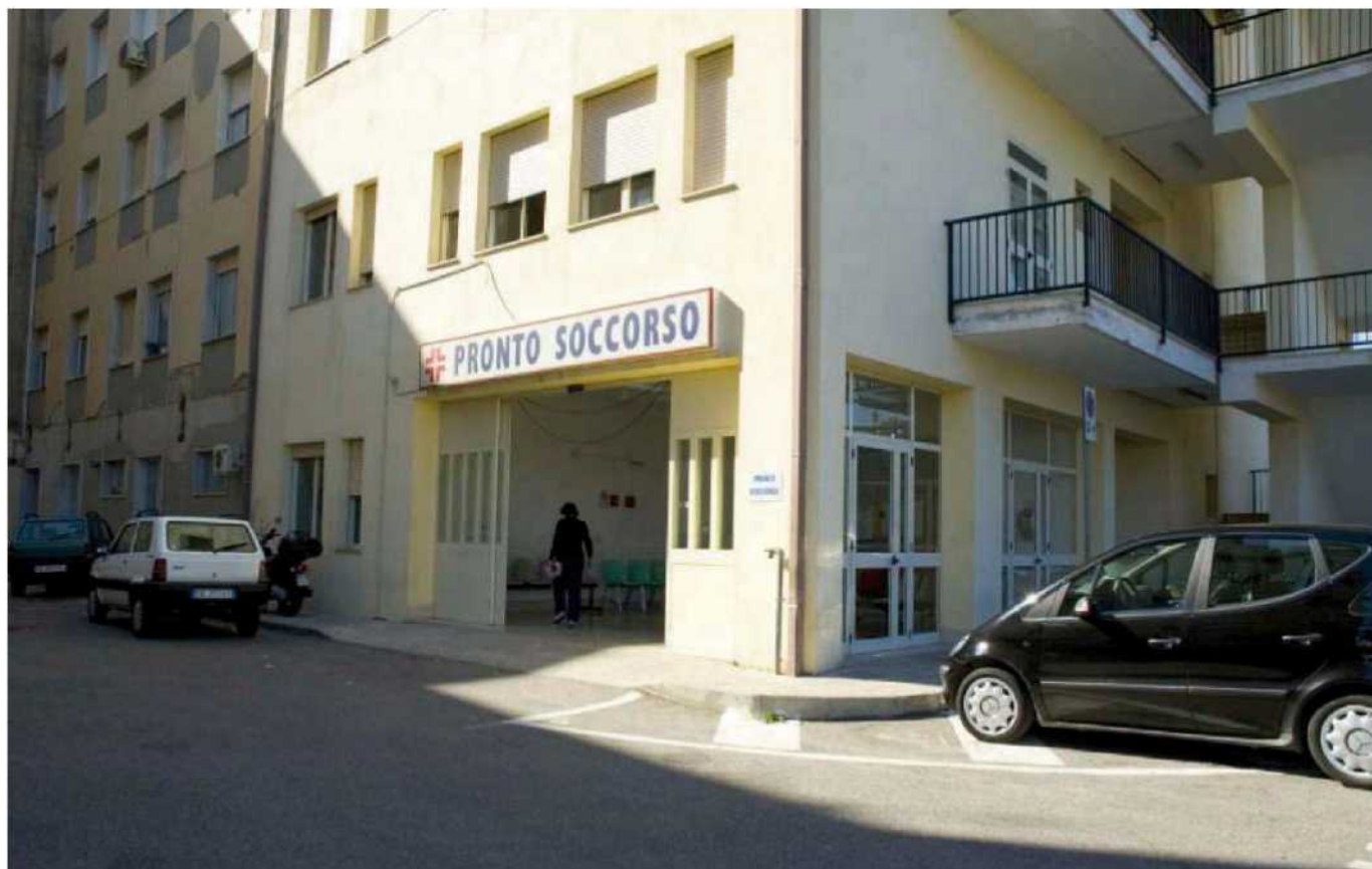
Secondo Taverniti l'ospedale di Soverato potrebbe avere un ottimo futuro "fondendosi" con il "Pugliese Ciaccio"