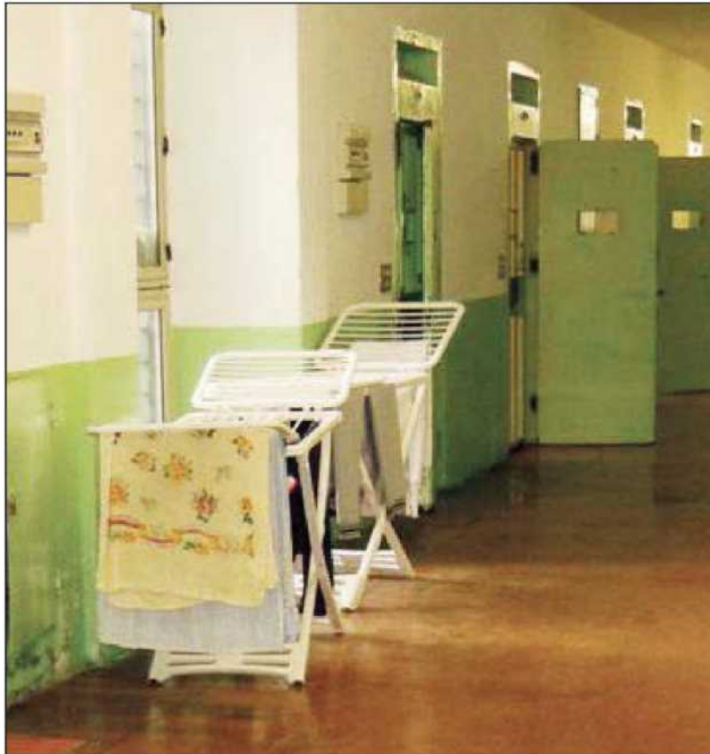
Una foto scattata all'interno del carcere di Catanzaro