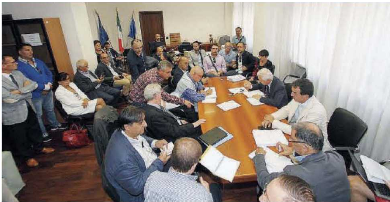
L'ufficio del commissario. Gremito dai rappresentanti dei lavoratori che ora possono guardare con più serenità al futuro