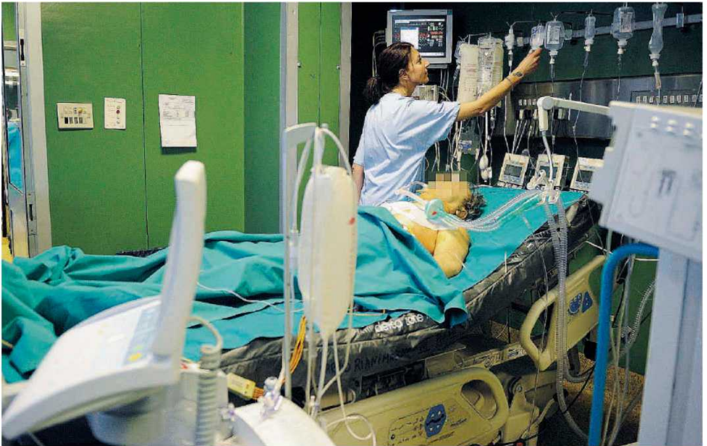
Il trapianto era andato benissimo. Il paziente cosentino ha contratto l'epatite a causa delle trasfusioni successive al delicato intervento