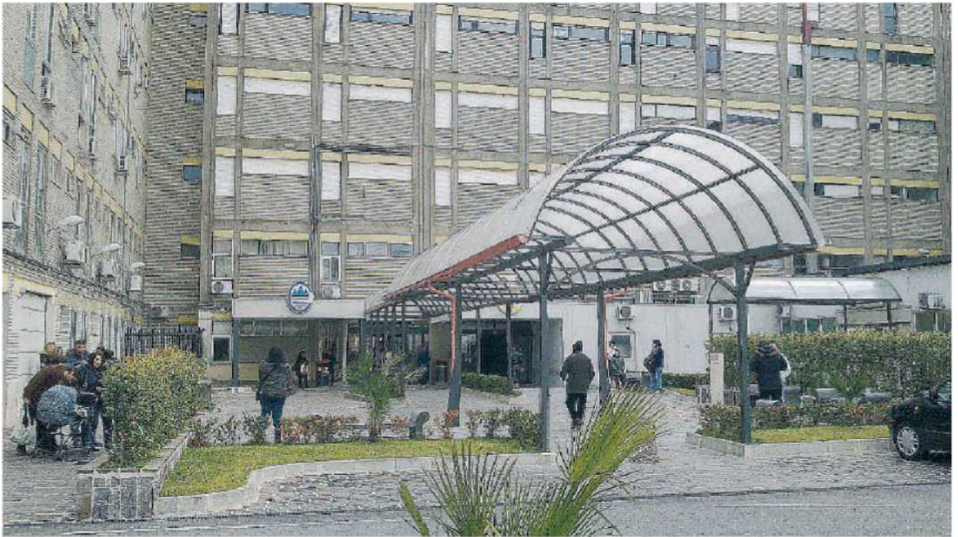
L'ospedale Pugliese. L'ingresso della struttura sanitaria dalla quale la donna non è più uscita