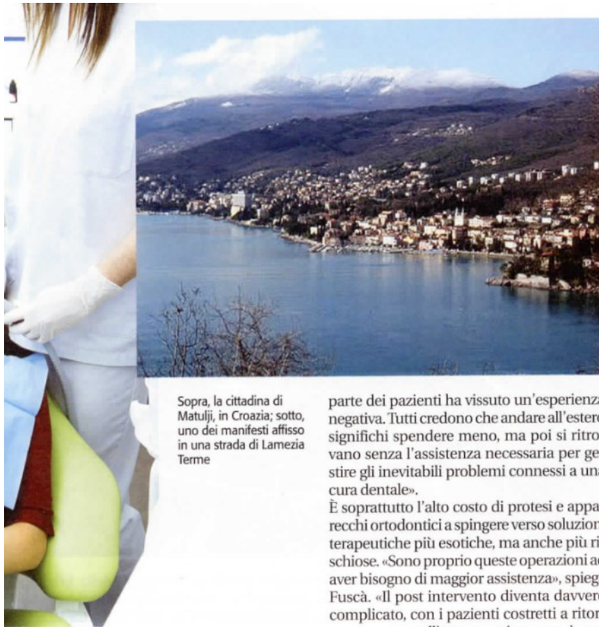
Sopra, la cittadina di Matulji, in Croazia; sotto, uno dei manifesti affisso in una strada di Lamezia Terme