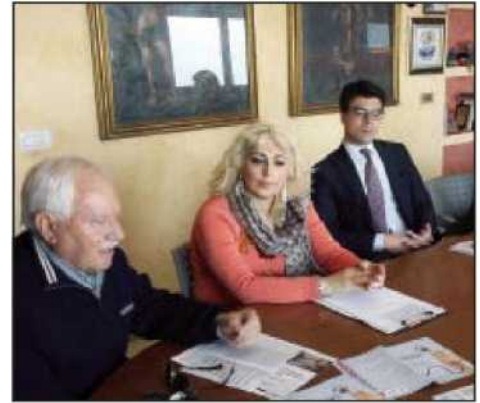
La conferenza stampa di presentazione del progetto