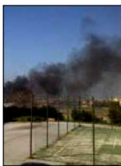
La nube tossica

giorno non solo perché ci distrae dalle lezioni ma anche perché ci provoca problemi di salute, tante volte infatti ci troviamo all'esterno in palestra e inaliamo i fumi che si disperdono nell'aria a causa dei vari incendi appiccicati dal villaggio rom a noi troppo vicino, basta dire che avvicinandoci alle finestre vediamo grossi