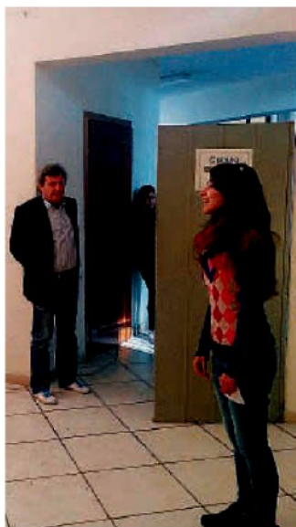
Una fase dei provini

TROPEA. Tanti aspiranti attori, provenienti persino dal Lazio, dalla Toscana e dalla Sicilia, ma anche tanti curiosi, hanno raggiunto nei giorni scorsi le sale della biblioteca comunale in occasione del casting organizzato dall'Avis di Tropea.