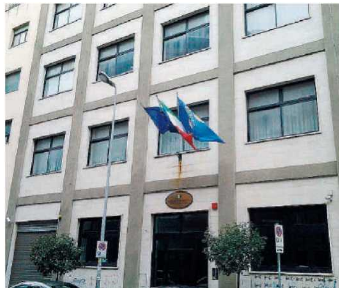
Dipartimento Salute. La convocazione dei direttori generali facenti funzioni è stata revocata e al loro posto sono stati invitati i neo commissari