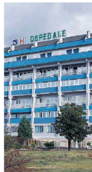
Ospedale blu. La recente tinteggiatura esterna

Per Mercuri «il look esterno all'ospedale cittadino si può benissimo paragonare all'abito nuovo di cui è vestito il defunto. Il nosocomio della città illuminato di sera, per la sua lunghezza, la sua altezza ed il suo colore, si può benissimo paragonare al mitico "Titanic", che affondò per la caparbietà di colui che lo progettò. Così sarà per l'ospedale, che per la caparbietà di qualcuno asservito alla classe politica catanzarese, lo sta affondando inesorabilmente davanti all'indifferenza della classe politica locale». ◀