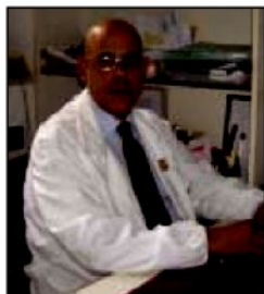
Il presidente De Filippo

«NON si comprende quali vantaggi possa portare ai residenti nella Provincia di Catanzaro l'accordo stipulato dall'Asp con Poste italiane per permettere la prenotazione di visite specialistiche ed esami diagnostici negli uffici postali».