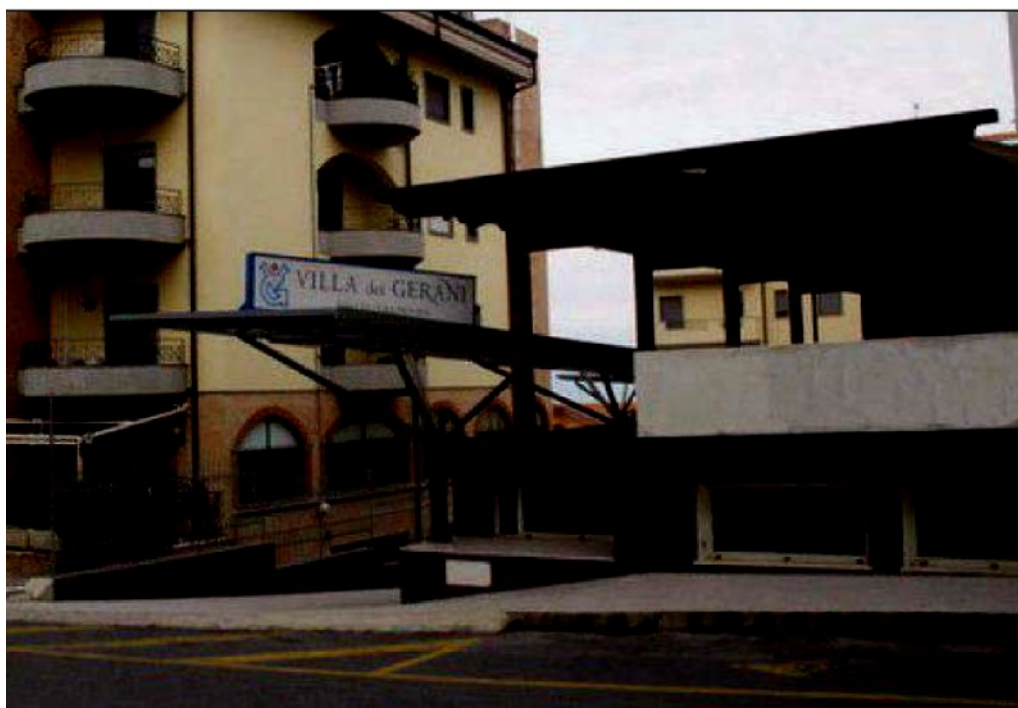
la clinica privata Villa dei Gerani

Incontro a Palazzo Rizzuti coi sindacati. Sit-in di una rappresentanza del personale