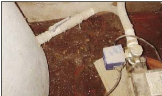
Inconveniente igienico sanitario in via Rossini