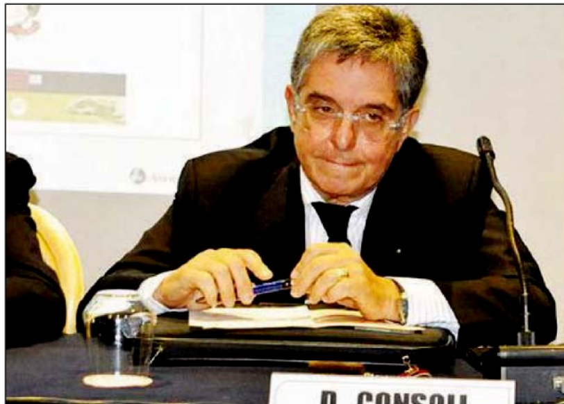
Il primario di Neuroscienze dell'ospedale civile Domenico Consoli

La decisione del primario quasi in "zona Cesarini" dopo la polemica con Maglia