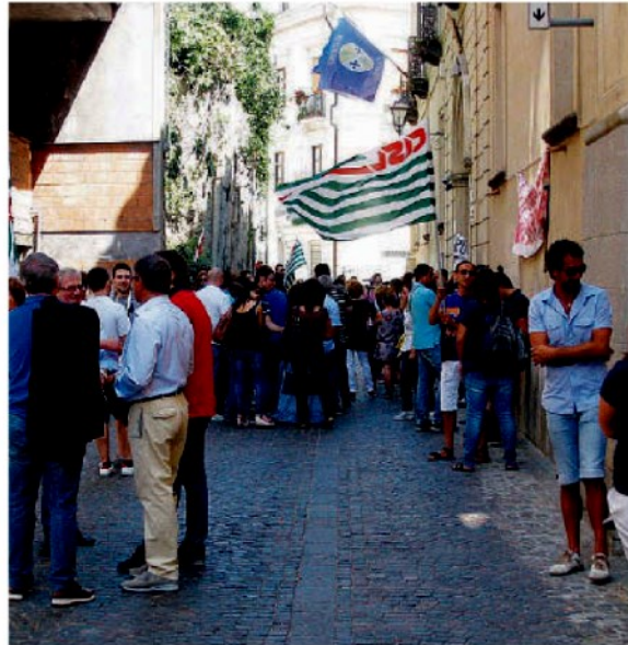
Le proteste. Il personale davanti a Palazzo Alemanni in una foto d'archivio