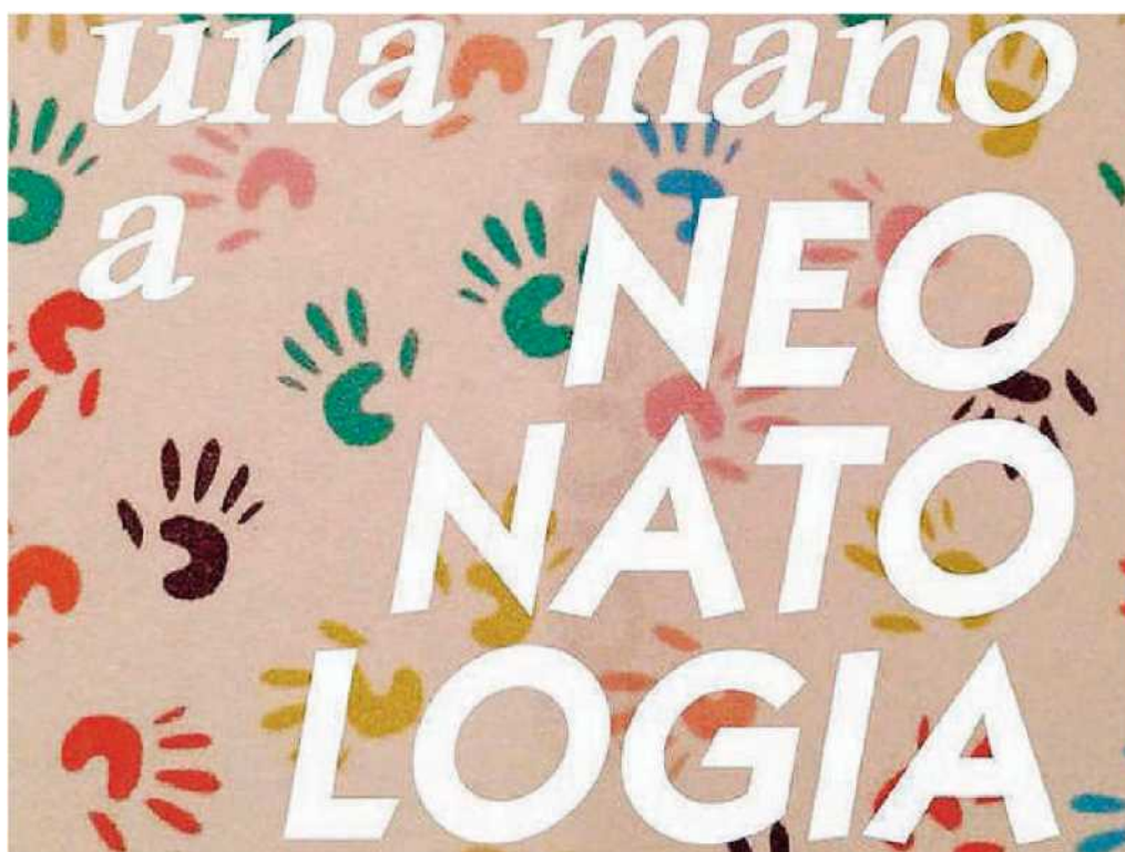
Il manifesto del comitato. Mobilitazione popolare per scongiurare la chiusura del reparto