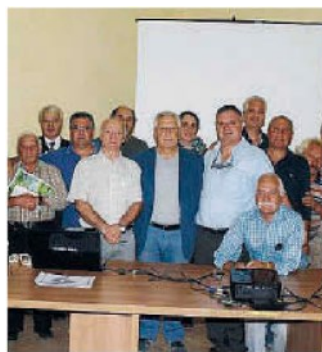
I partecipanti al corso.

La Regione, le Province, i Comuni, le Comunità montane e le Associazioni micologiche iscritte all'albo Regionale, avvalendosi dell'Ispettorato Micologico dall'Asp competente per territorio, promuovono l'organizzazione e lo svolgimento di corsi didattici, il cui superamento condizione necessaria per il rilascio o il rinnovo della tessera professionale. ◀ (Sa.Inc.)