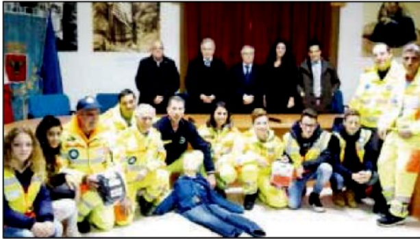
Il gruppo dopo la consegna del defibrillatore