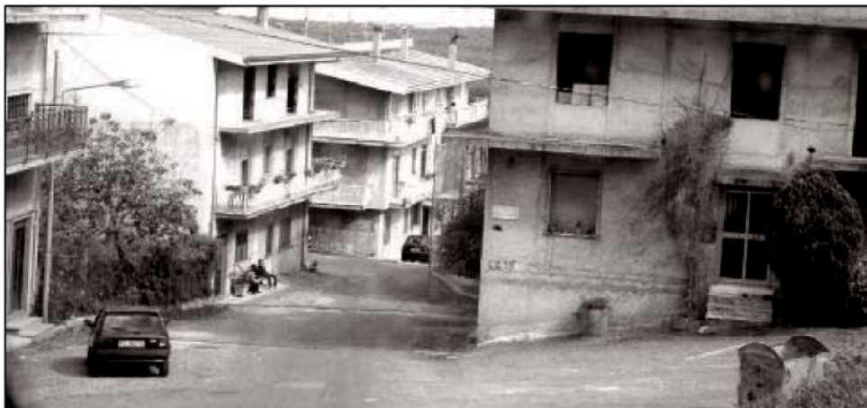
Il quartiere "Case Nuove" a Rombiolo: qui si registra un'alta incidenza tumorale

I controlli serviranno a scoprire eventuali contaminazioni ambientali