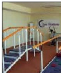
Una delle palestre

Il Centro clinico San Vitaliano, struttura privata specializzata nel trattamento della Sla e delle malattie neuromuscolari (distrofia muscolare e amiotrofia spinale), nonché della riabilitazione estensiva, nasce dalle ceneri di Villa Puca, struttura per il trattamento delle malattie psichiatriche. È il 28 gennaio 2011. La cerimonia è una passerella di politici, autorità civili e religiose che si contrappone alla presenza di familiari dei malati di Sla, nonché soci dell'Aisla, e gli stessi ammalati, che con la loro volontà accompagnarono l'iter che ha portato all'apertura del Centro rilevato dal gruppo che fa capo alla famiglia Citrigno. La ri-