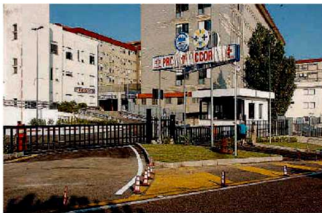
L’ingresso del Pronto soccorso dell’ospedale “Pugliese” di Catanzaro

Scarfone nella sua lettera evidenziava l’incongruenza dell’unità di Ortopedia collocata al quarto piano, dell’unica sedia a rotelle del reparto e dell’unico medico di turno che vigila sui due reparti (maschile e femminile) posti su due piani