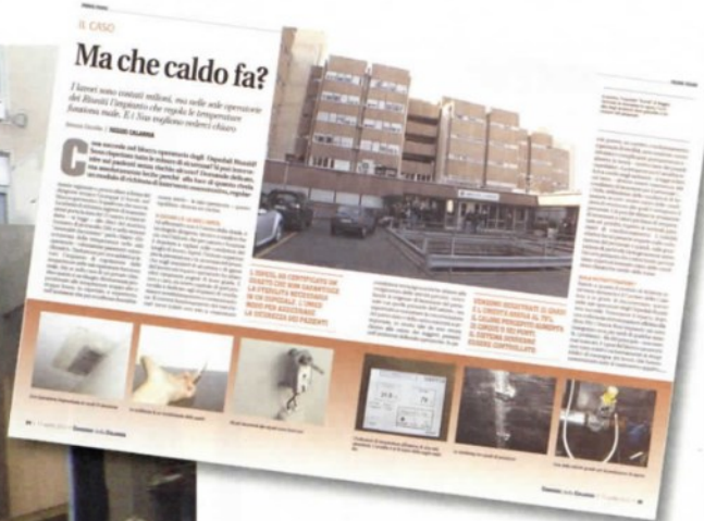
Sopra, il servizio del Corriere della Calabria , pubblicato sul numero 146, nel quale si descrivevano con foto e documenti alcune anomalie nel reparto di Chirurgia degli Ospedali Riuniti di Reggio (a sinistra). A pagina 20, in basso, una riparazione improvvisata ai canali di aerazione

quella coibentazione necessaria a garantire il funzionamento degli impianti – dunque il corretto mantenimento di umidità e temperatura. E ancora, è la stessa ditta a dichiarare che le sue squadre si dovranno occupare del ripristino e sistemazione «di isolamenti e rivestimento di linee ed apparecchiature del produttore di vapore sterile» e «delle apparecchiature e linee di alimentazione delle batterie di post riscaldamento a servizio del gruppo operatorio». Anche in questo caso, si tratta di snodi centrali del sistema che regola le temperature in reparto, ma soprattutto nelle sale operatorie, dove il mancato o malfunzionamento dell'impianto non è un semplice disagio, ma un rischio.