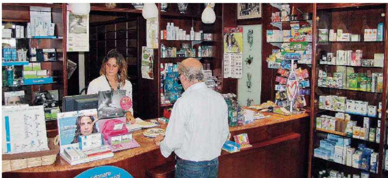
Nuovo ruolo. Con il progetto "Farmacia dei servizi" si potrà limitare l'accesso alle strutture ospedaliere