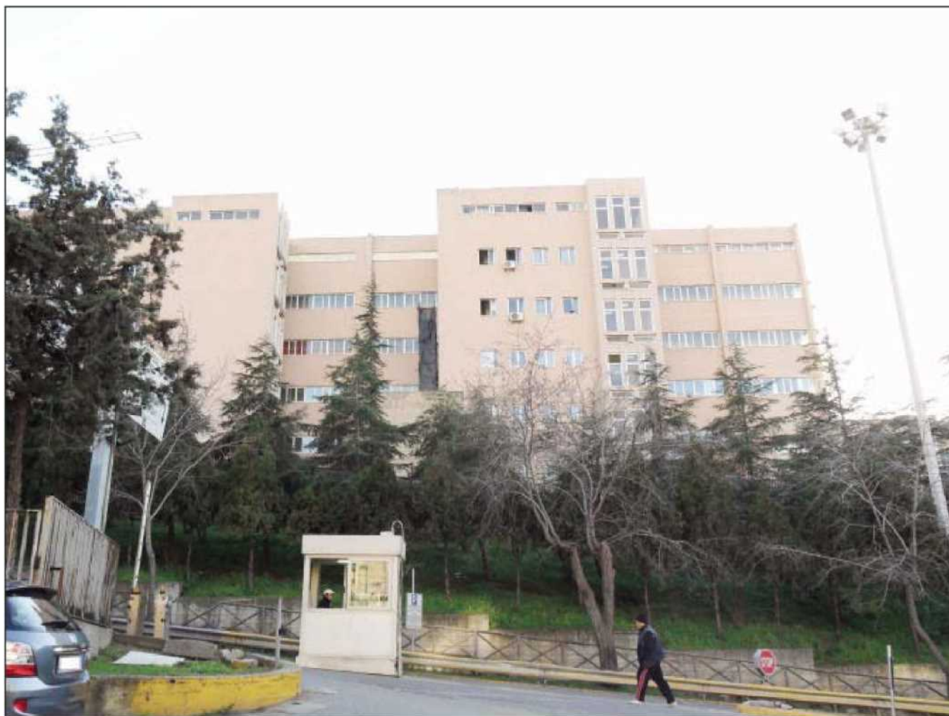
Gli ospedali Riuniti di Reggio Calabria