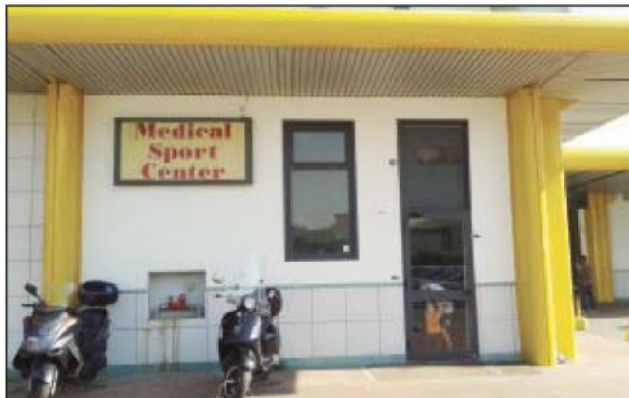
La sede della Medical sport center