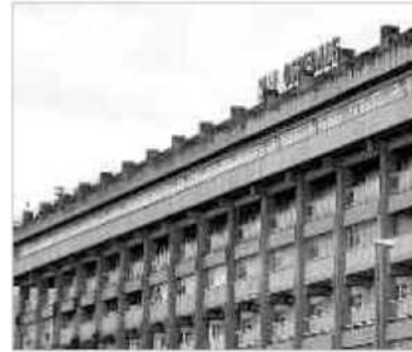
La sede dell'ospedale di Lamezia Terme

TIZIANA BAGNATO t.bagnato@calabriaora.it