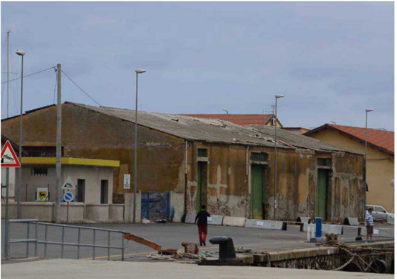
Il vecchio edificio ubicato sulla banchina Tripoli, nell'area portuale di Vibo Marina, che ha subito il crollo parziale del tetto in eternit