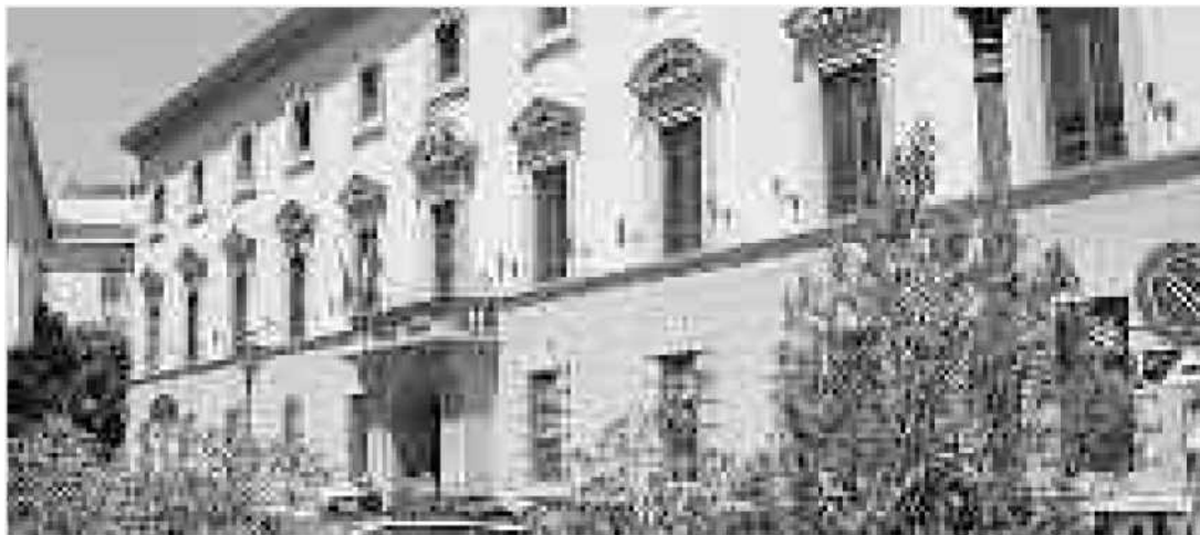
La sede del Comune Palazzo de Nobili