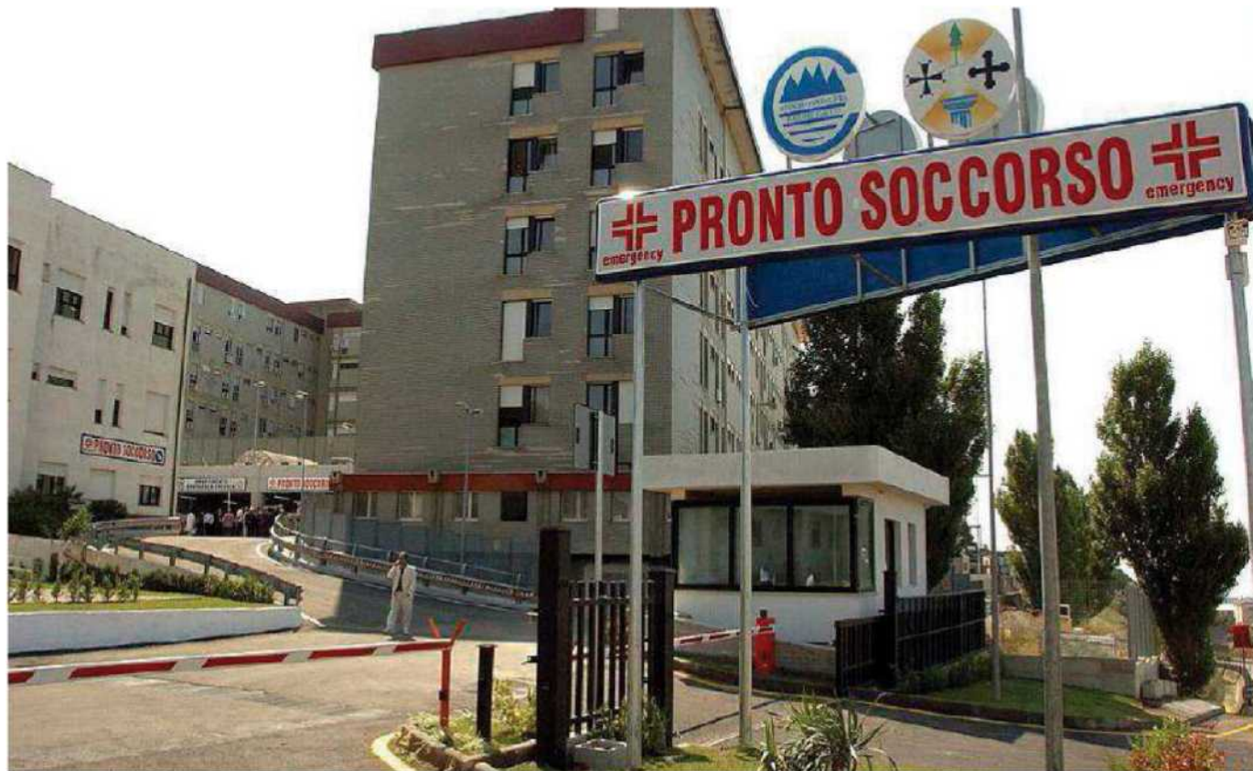
Il pronto soccorso del Pugliese rischia sempre più di "scoppiare"