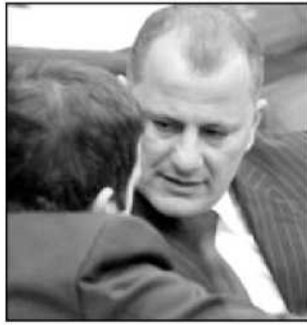
Corsi e Costanzo (Pdl)