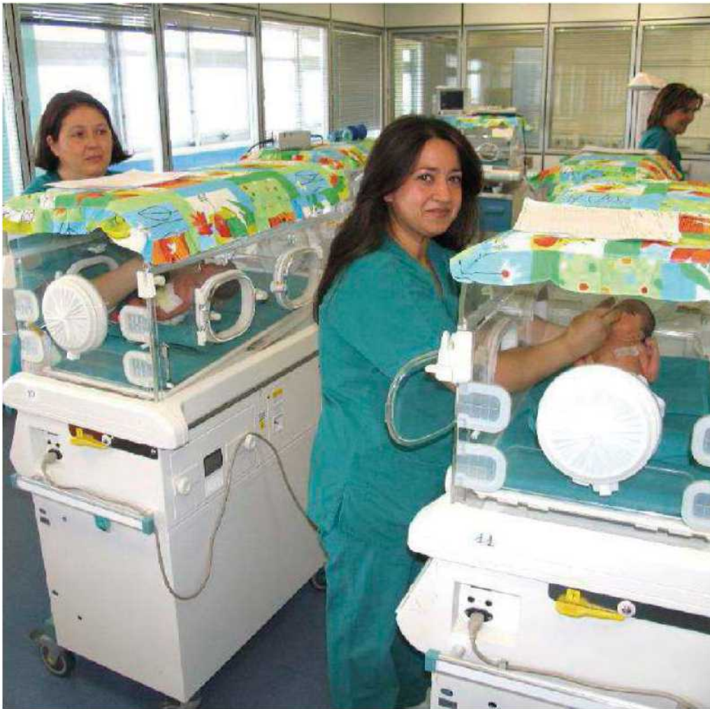
Il reparto di terapia intensiva neonatale ristrutturato nel 2006