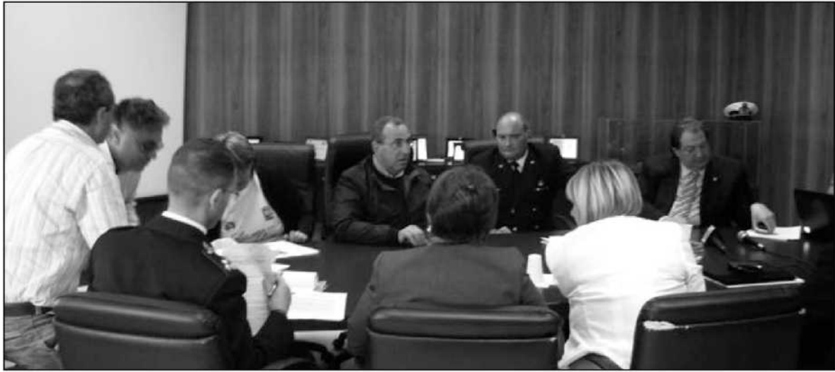
Il vertice nella sede della Capitaneria di Porto per decidere il da farsi dopo la dispersione delle polveri di amianto