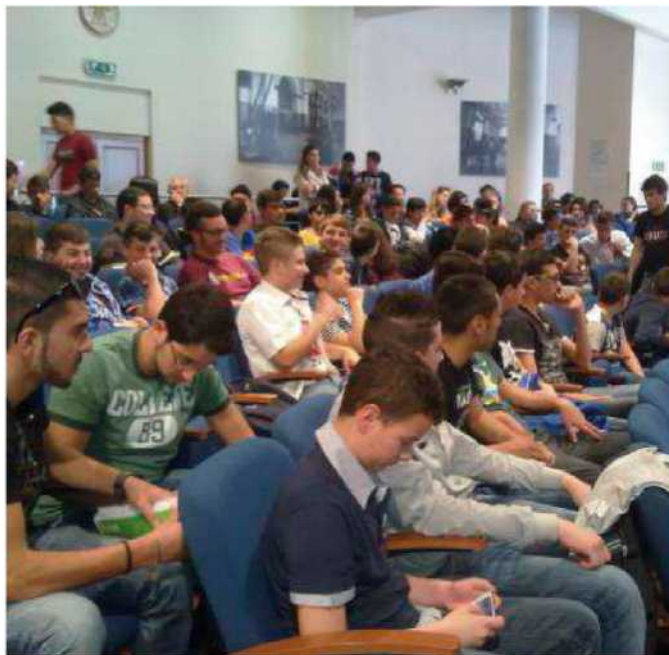
Alunni delle prime classi dell'Itis Scaffaro che hanno partecipato al progetto