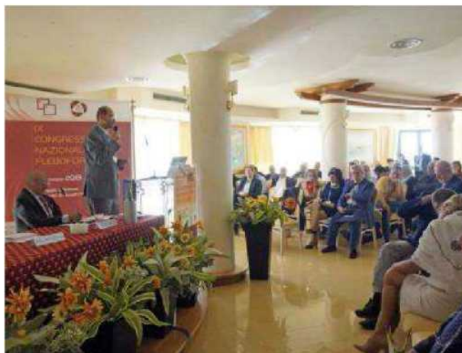
Un momento dei lavori svoltisi a San Nicolò di Ricadi

Oltre a medici e fisioterapisti, il congresso ha inoltre visto la partecipazione di infermieri e studenti universitari i quali hanno avuto l'occasione di approfondire la propria formazione, attraverso i fondamentali temi di studio trattati durante i lavori. ◀