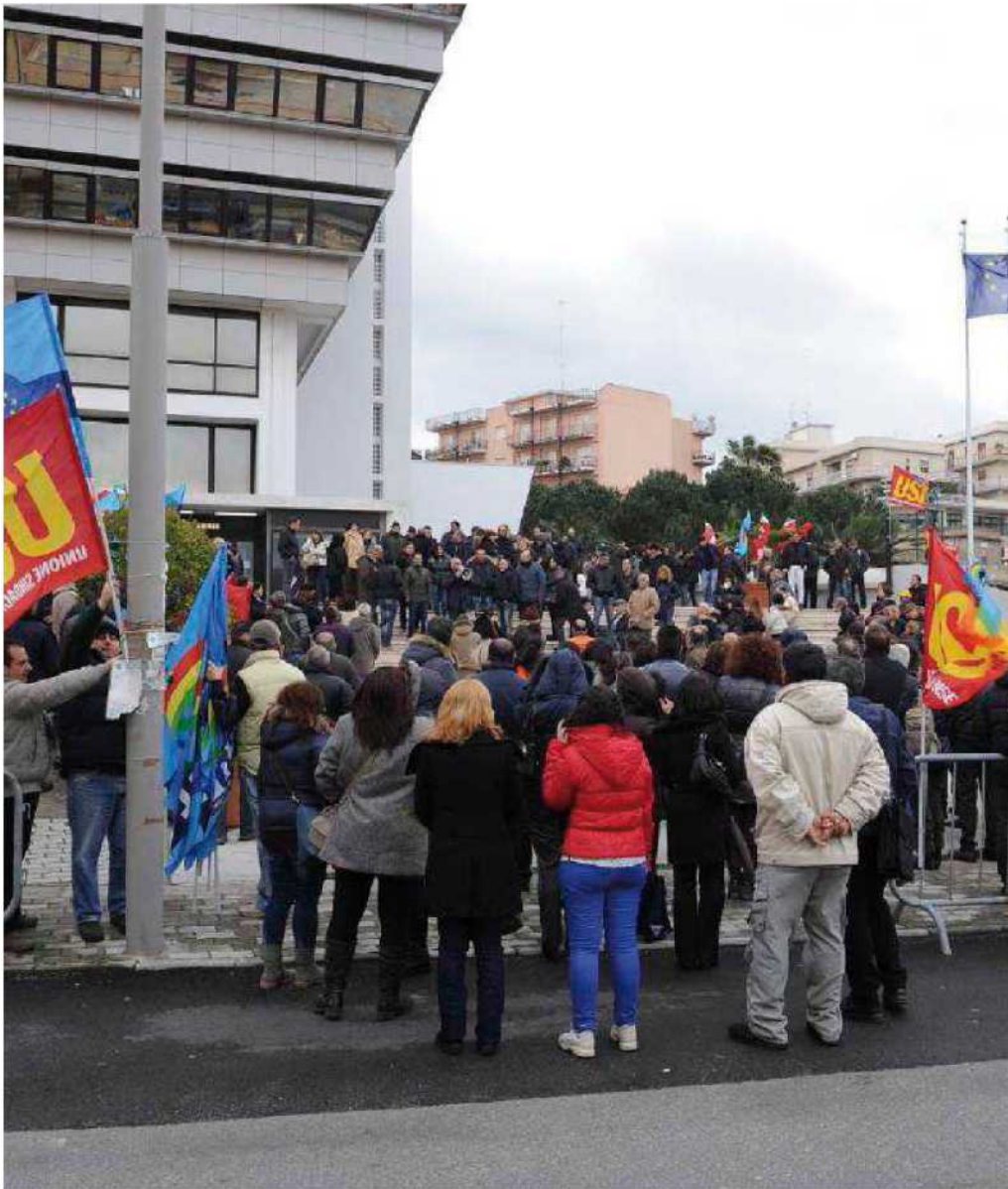
Una recente protesta dei precari davanti alla sede del Consiglio regionale