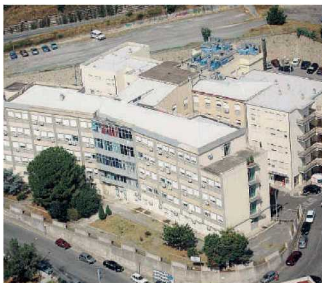
Ospedale di Soverato. È da sempre riferimento unico di un territorio esteso

«Come sindaco di Soverato, ma prima ancora come cittadino e genitore, non posso accettare questo stato delle cose. La pediatria, la medicina d'urgenza, l'ortopedia e tanti altri reparti e servizi hanno bisogno di poter funzionare a pieno regime e con il personale necessario per assicurare un'assistenza puntuale e continua. L'amministrazione, che mi pregio di rappresentare, non starà certo a guardare e nei prossimi giorni si attiverà per intraprendere tutte quelle azioni necessarie a far sentire la propria voce con il chiaro intento di invertire la rotta. Per troppo tempo siamo rimasti a guardare ma oggi Soverato, assieme all'intero comprensorio e superando i colori e le appartenenze politiche, deve lottare per far valere le proprie esigenze ed i propri diritti tornando finalmente ad essere protagonista del proprio destino». ◀