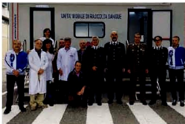
Carabinieri e volontari. Il personale che ha contribuito alla raccolta