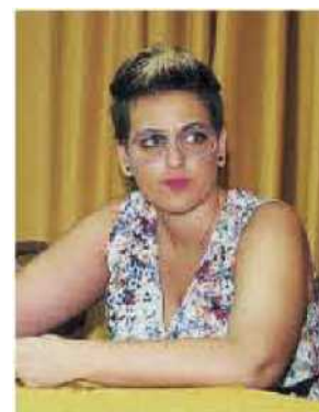
Dalila Nesci. Deputata del Movimento 5 Stelle

Giovedì il commissario Scura a Reggio incontrerà i sindacati sulla situazione sanitaria di quel territorio. Soprattutto all'Asp regna il caos: la triade commissariale scelta da Oliverio per gestire il dopo-Giofrè non si è ancora insediata. Sembra vi sia incompatibilità tra la disponibilità part time dei due viceprefetti e la norma che invece prevede un incarico esclusivo. ▶